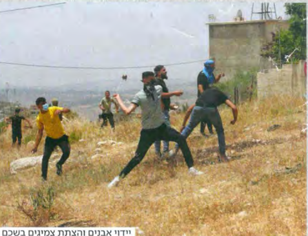
ידיו אבנים והצתת צמיגים בשכם