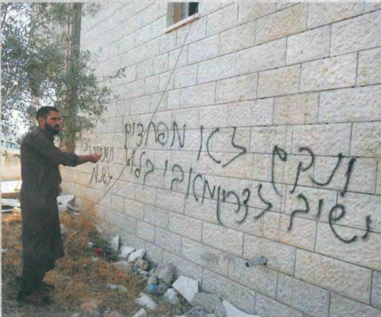
על רקע המתיחות בין הצבא והמשטרה למתיישבים, רוססו כתובת גרפית על מסגד ביו"ש עם הכיתוב: "ונקם ישיב לצריו. לא מפחדים מאבי בלוט תמישכו לגנות"