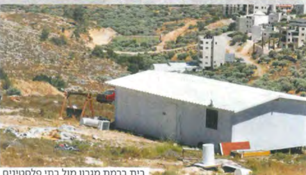
בית ברמת מגרון מול בתי פלסטינים