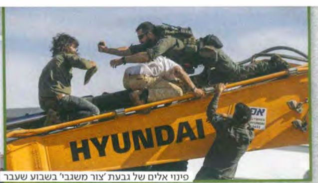
פינוי אלים של גבעת 'צור משגבי' בשבוע שעבר