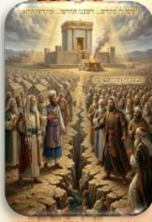
קרח ו 250 ראשי סנהדרות כנגד משה ואהרן. מה עם כבוד ה'

כולנו גדלנו וחונכנו ללכת אחרי גדולי ישראל, בכל דבר גם אם לא מבנים, וא"כ קשה לי מאוד, שגם בפרשה הזאת וגם בקודמת קורה דברים מאוד קשים ולא מובנים, שמצד אחד אנחנו רואים את קורה שהיה מגדולי הדור וכן היו עימו רוב גדולי הדור (250 ראשי סנהדרות) וכנגדם עמדו משה ואהרן, והרבה מעם ישראל הלך אחרי קרח ועדתו, וגם קרח ועדתו נבלעו באדמה וגם פרצה מגיפה שלקחה יותר מ-14,700 קרבנות, וזאת למרות שלכאור הם הלכו אחרי רוב גדולי הדור, וכי"ב היה בפרשה הקודמת שרוב נשיאי השבטים היו בדעה אחת שא"י זה מקום מסוכן ולא עולים אליו, ורק יהושע וכלב היו נגד, וגם כאן עם ישראל האמין לרוב ובסוף גם הוא נעשה כולם לא נכנסו לארץ, וזה תמוה כיצד אפשר להעניש עם שלם שהלך אחרי רוב גדולי הדור שהיו כוננו? אבל נראה שצ"ל שגם אם יש גדולי הדור מ"מ על משה רבינו ותורתו שכל דבריו מהקב"ה לא שייך לחולק ואפי' יהיו רובם נגד משה צריך לילך אחרי משה רבינו ותורתו בלבד. והנה היום בימינו יש מציאות שהתורה כתבה לנו לבנות את ביהמ"ק, וזה מצוה שקיימת בכל הדורות, ולא קשורה למשיח, וכך כתבו מפורש כל הפוסקים, ורש"י בכמה מקומות, והרמב"ם, ואף במנ"ח (מצוה צה) כתב מפרש שאם נוכל לבנות ביהמ"ק נרוץ ונבנה היום, וכ"כ עשרות רבנים ופוסקים