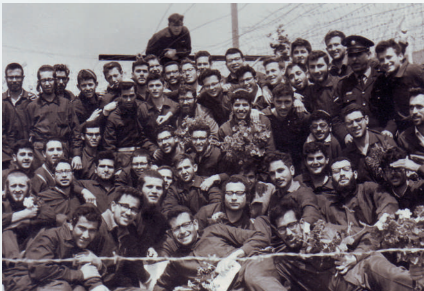
כמאה בחורים מישיבת חברון שנעצרו במחאות כנגד המסיון