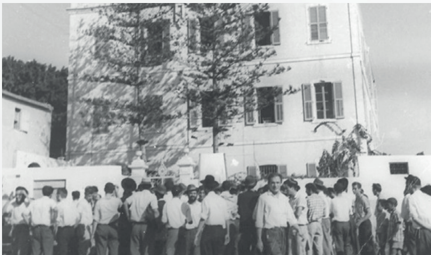
הפגנת מאות בחורי ישיבת חברון שנת תשכ"ד נגד המסיון

על הערכים והאמונות שלהם, בכל צורה שהיא, והדבר הגיוני, מקובל, ולגיטימי מאין כמוהו. (וכמובן שאין מדובר על שימוש באלימות פיזית, שאינה דרכו של הציבור החרדי כידוע, אלא על הפגנות רגילות בצורה המקובלת בכל העולם המערבי, הכוללת מחאות סוערות, תוך כדי שיבוש הסדר הציבורי ברמה מסויימת לצורך הבעת המחאה החריפה).