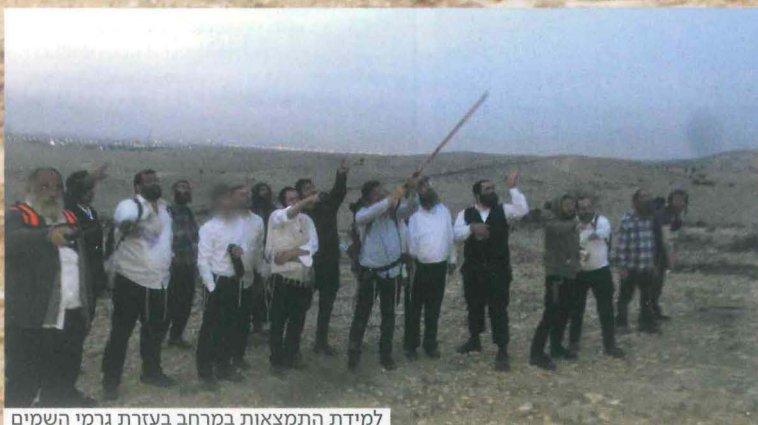
למידת התמצאות במרחב בעזרת גרמי השמים