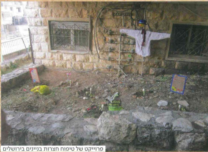
פרויקט של טיפוח חצרות בניינים בירושלים