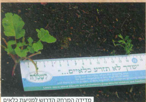
מדידה המרחק הדרוש למניעת כלאים