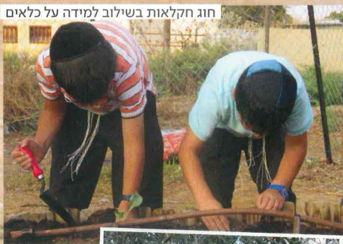
חוג חקלאות בשילוב למידה על כלאים