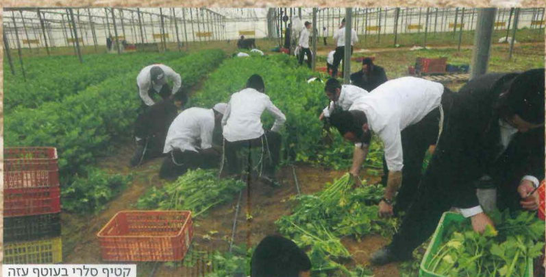
קטיפ סלרי בעוטף עזה