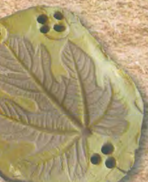
תדפיס של עלה תאנה. יצירה מסדנת אמנות מהטבע