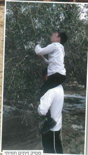
מסיק זיתים חוויתי

"בשלב מסוים הפעילות התרחבה כל כך, שכבר לא היו לנו מדריכים ומדריכות לשבץ. החלטנו לפתוח הכשרה ייעודית שרוב הבוגרים שלה השתבצו בתוכניות שלנו. יש לנו קורס גינון טיפולי בהתמחות בסמינר הישן בירושלים וקורס נשים נוסף באלעד. אחרי 3 מחזורים, אנחנו מתכננים לפתוח מחזור מיוחד לגברים, כרגע בוחנים אם יש ביקוש. קורס אחר שלנו הוא "תקן פלוס", הכשרת מדריכי טיולים מסוג שונה. משום מה, בלא מעט מוסדות לימוד, טיולים בטבע נתפסים כדבר משעמם, והתלמידים - ואולי גם ההורים שלהם - מצפים לאטרקציות. אנחנו מכשירים מדריכים שיהיו מסוגלים להפוך את הטבע עצמו לאטרקציה: ינווטו עם הילדים במרחבים, ילמדו אותם מה מותר ללקט לאכילה ומה אסור, כדי להפוך את הטיול להרפתקה. את הקורס הזה עשינו בשיתוף עם ישראל שפירא, מנכ"ל טיולים ותיק".