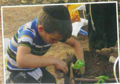
חוג גינון במושב יסודות