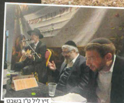
זיץ ליל ט"ו בשבט