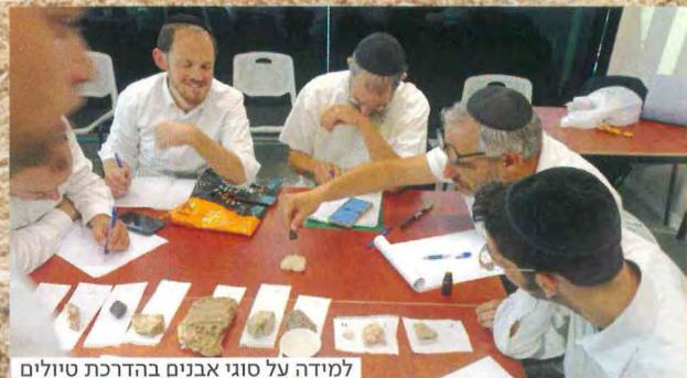
למידה על סוגי אבנים בהדרכת טיולים