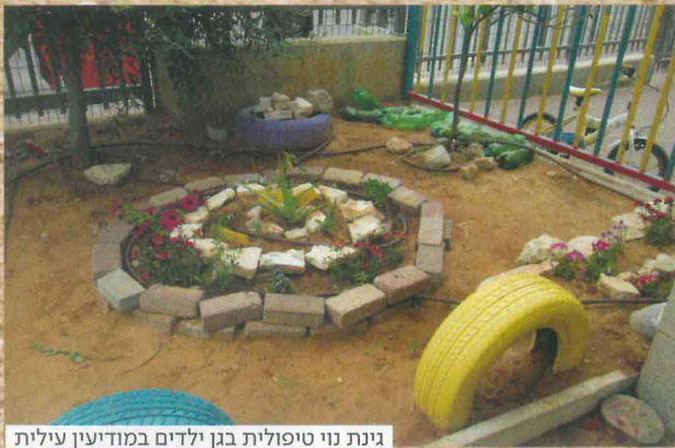
גינת נוי טיפולית בגן ילדים במודיעין עולית