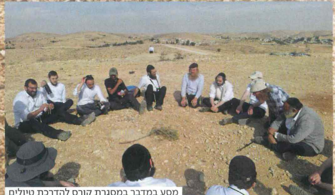
מסע במדבר במסגרת קורס להדרכת טיולים