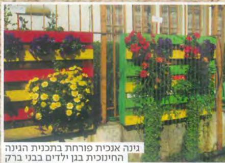
גינה אנכית פורחת בתכנית הגינה החינוכית בגן ילדים בבני ברק