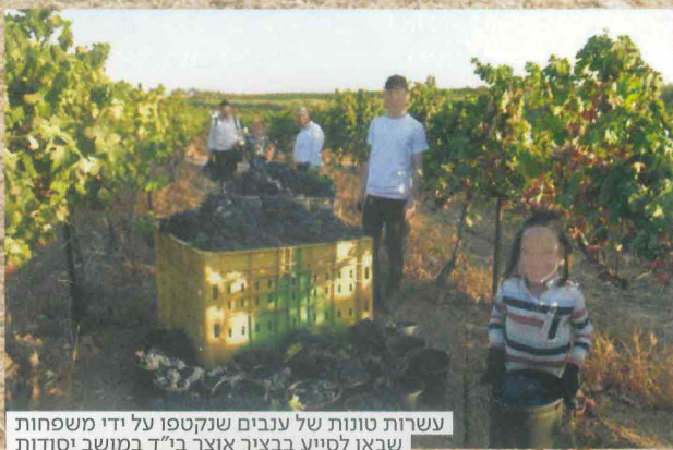
עשרות טונות של ענבים שנקטפו על ידי משפחות שבאו לסייע בבציר אוצר ביד"ב במושב יסודות