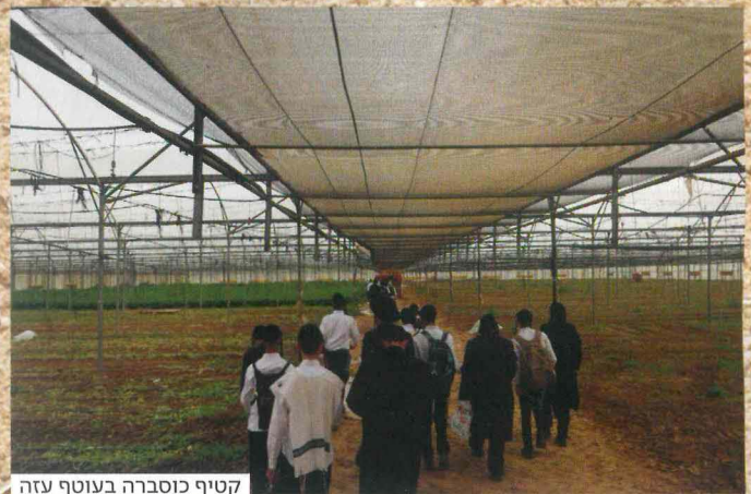
קטיף כוסברה בעוטף עזה

"התייתמתי מאבי כשהייתי בן 15. שנים אחדות לאחר מכן נישאה אימי שוב, עם בן מושב גמזו, ועברנו להתגורר שם. במושב מצאתי עולם חדש ומופלא. התחלתי להציק לחקלאים סביבי בשאלות בלתי פוסקות; כך למדתי מקרוב על עולם הטבע ועבודת האדמה. בהמשך, כבר כאברך כולל, העברתי חוגי גינון לילדים ועברתי הכשרה מקצועית ומקיפה בתחום הגננות הטיפולית. גיליתי כמה הציבור שלנו רחוק מעולם הטבע ועבודת האדמה. אני מעריך שכ-20% מהציבור לא מתחברים לטבע, כ-20% ממנו קשור לטבע בכל נימי נפשו וכל השאר נמצאים איפשהו על הרצף. חלק גדול מהם פשוט לא יודעים עד כמה החיבור לטבע יכול לעשות להם טוב. כשהם נחשפים ולומדים להכיר, מתעורר משהו. לכל אותם 80% הטבע פשוט לא היה נגישי".