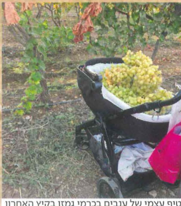
קטיפ עצמי של ענבים בכרמי גמזו בקיץ האחרון

עוד דוגמה: הלכות כלאיים. אלו הלכות שאנשים מכירים באופן חלקי ונבהלים כשהם רואים צמחים שונים שענפיהם משתרגים זה בזה. ברוב הצמחים, כשיש את המרחק הדרוש מהנקודה ממנה הם יוצאים מהקרקע, אין איסור כלאיים. בערים חרדיות רבות יש כוללים מעל גני ילדים; לא פעם קורה שגננות שעברו את ההכשרה שלנו ושתלו יחד עם ילדי הגן גינה נהדרת, נתקלות באברכי כולל שעברו ליד הגן בדרכם לכולל ונבהלים ממה שנראה כמו כלאיים. למי שמעיר או שואל, אני מנחה אותן להגיד שזו ההלכה שהן למדו ואפשר לברר אותה בבית המדרש של הרב אפרתי. בגינות הראשונות שהקמנו בגני ילדים במודיעין עילית, ביקשו הגננות לשאול את רב העיר, הרב קסלר, אם הן יכולות לערוך בעצמן הפרשת תרומות ומעשרות או שיש לקרוא לתלמיד חכם. התשובה שלו הייתה שאם הן יודעות היטב את ההלכות, אין שום הבדל בין הפרשת חלה להפרשת תרומות ומעשרות".