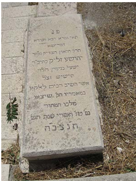
צינונו של הפרוש מקעלם בעל עין תרשיש זצ"ל בהר הזיתים