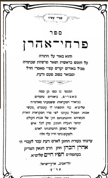
סער ספרו פרחי אהרן עה"ת