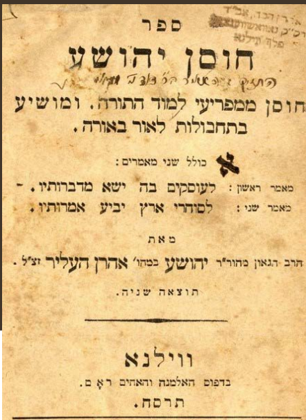
חתימתו על ספר חוסן יהושע שהיה ברשותו