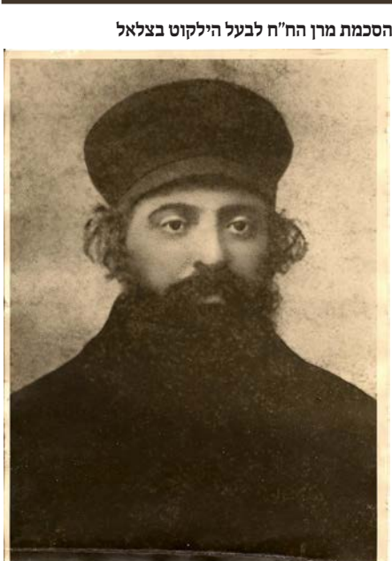
גיסו הגה"צ רבי אליקים געציל לעוויטאן זצ"ל המגיד בבריסק