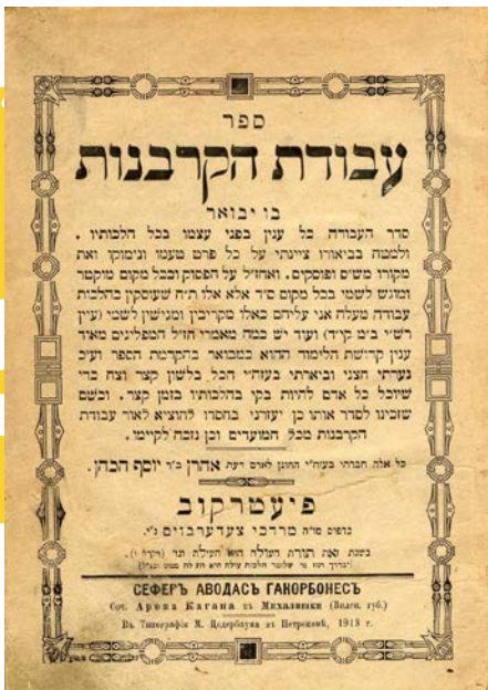
שער ספרו עבודת הקרבנות