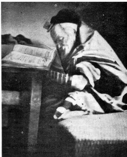
מרן החפ"ץ חיים ז"ע

הגר"י לנדא מציין בהמלצתו להרמ"ש סובול כשד"ר בית היתומים דיסקין'