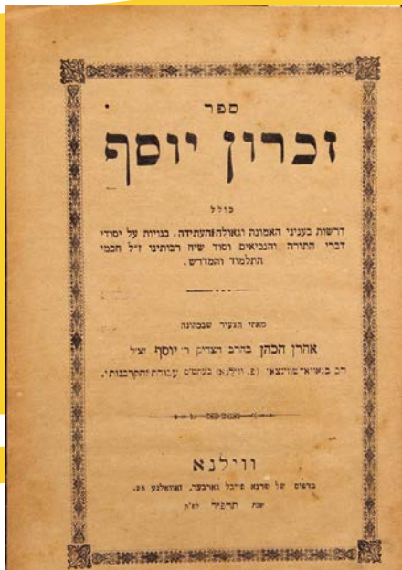
ספרו לחיזוק בעניני האמונה וגאולה