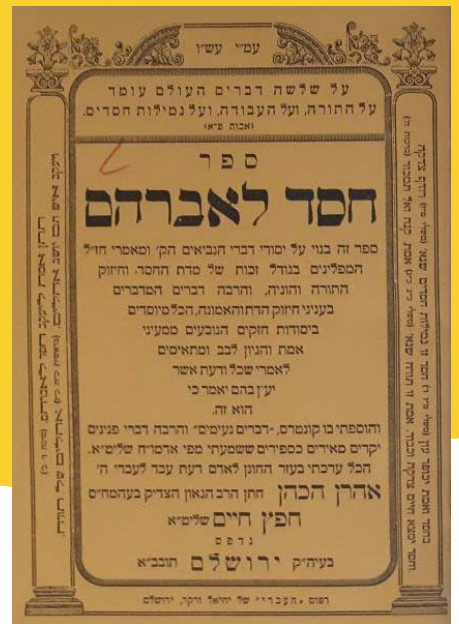
שער ספרו חסד לאברהם בהם הביא גם הרבה מדברי חותנו הח"ח ז"ע