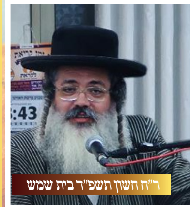
ר"ח חשוון תשפ"ד בית שמש

אני מקריא לפניכם מספר 'תהילות ישראל' מהמגיד מקוזניץ זצ"ל בו תשמעו שכל תפילות ישראל עולים לשמים בזכות התפילה שאנחנו עושים כאן, והתפילה הזאת עוטפת את כל תפילות ישראל כמו עטיפה שבלעדיה אי אפשר לשלוח את המכתב, וזה לשונו הקדוש של המגיד מקוזניץ בפרק ק"ב: "תפלה לעני כי יעטוף" דהנה מה שאנו מתפללין בכל יום על ביאת משיחנו במהרה בימינו, זו נקראת תפלה דמסכנא וכו', ועל ידי התפילה זו דמסכנא כל התפילות נענים שמתעטפים בזה התפילה. וזהו "תפלה לעני כי יעטף ולפני ה' ישפוך שיחו", וזהו פירוש הפסוק "והתפללו אליך דרך ארצם, שכל התפילות מקובלים לפני הקב"ה רק דרך ארצם להביא אותנו לארצינו בביאת משיחנו במהרה.