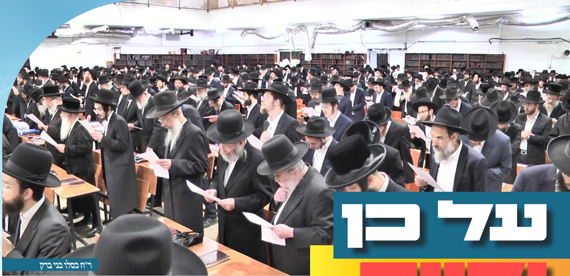
ר"ח כסליו בני ברק

המראות מהכינוס הגדול בבני ברק לבקשת הגאולה ר"ח כסליו תשפ"ד