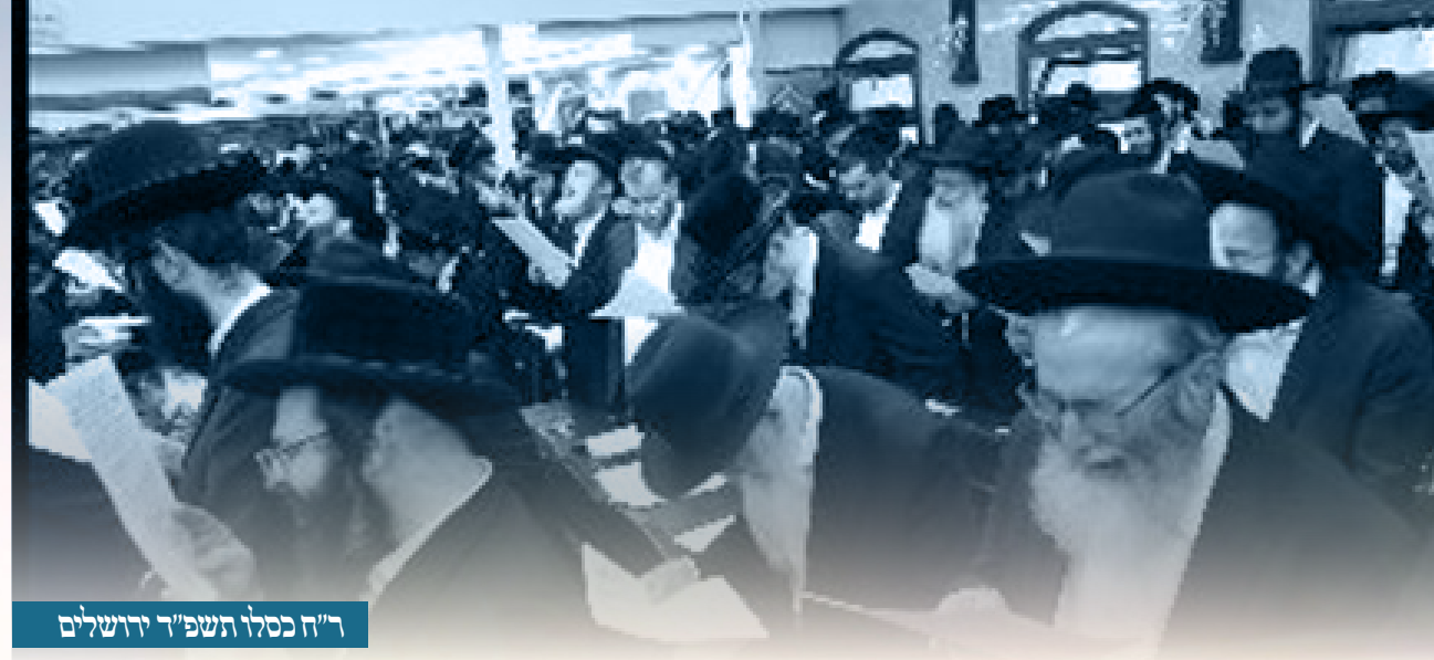
ר"ח כסלו תשפ"ד ירושלים