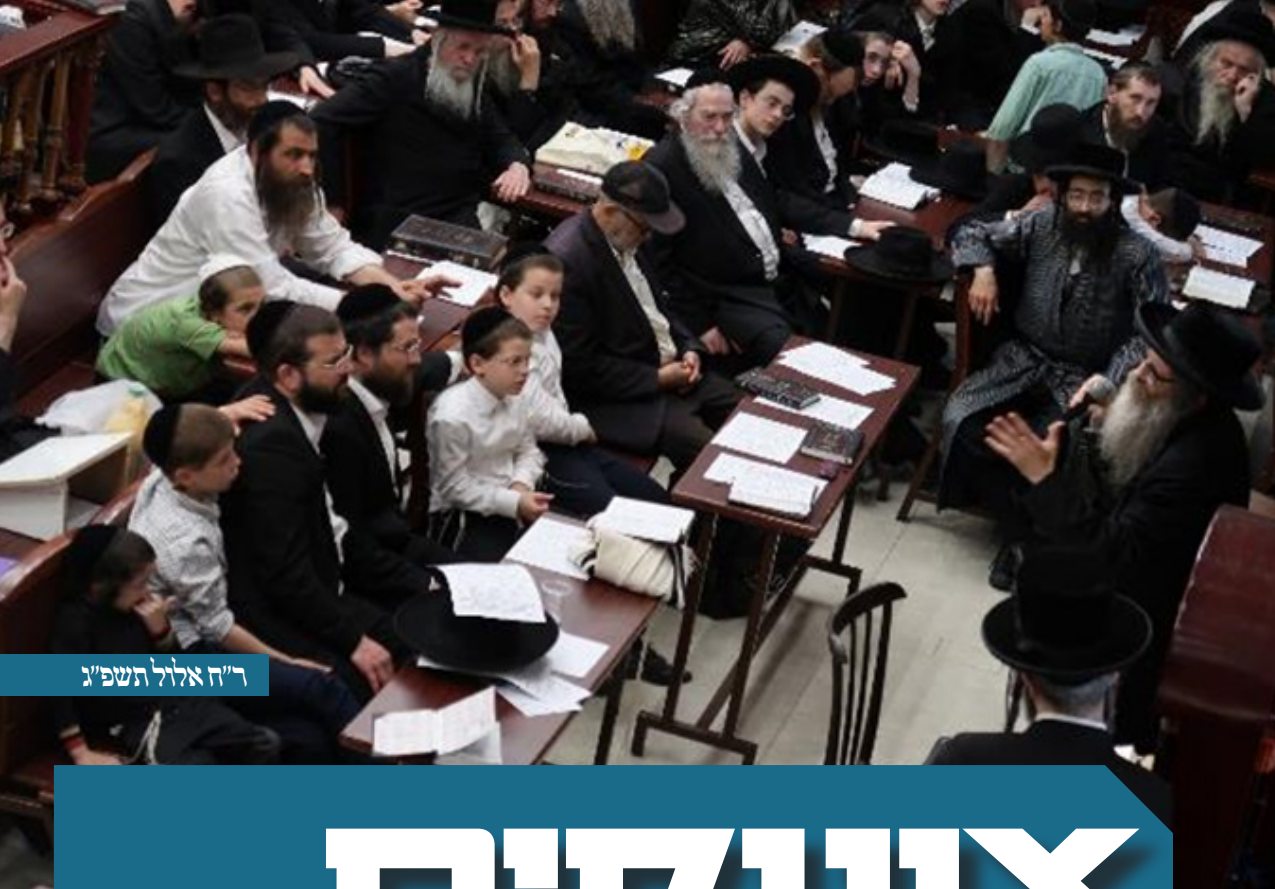
ר"ח אלול תשפ"ג