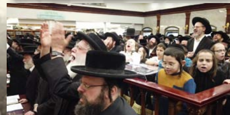
ר"ח כסלו תשפ"ד ירושלים