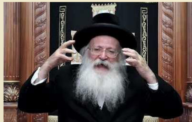
ר"ח תמוז תשפ"ג בני ברק

כשרואים אסונות וחושבים שזה לא נוגע אלי, צריך לזכור שבעגלה ערופה התורה מלמדת שתובעים מאיתנו כל אסון שמתרחש בעיר, ואותו דבר תובעים מאיתנו שלא נבנה בית המקדש, ומי שלא נבנה בית המקדש בימיו כאילו נחרב בימיו, כל אחד ואחד נתבע על זה, בתחילת פרשת וארא אומר ה'אור החיים' שה' אמר אם תתפללו אלי אני יקרב את הקץ גם אם לא הגיע זמן, בידינו להביא את בית המקדש ויתבעו מאיתנו אם לא נעשה מה שאנחנו צריכים לעשות בענין. בתרגום יונתן בן עוזיאל בישעיה מובא שאפילו יחיד אם יהיה איכפת לו באמת צער השכינה בזכותו לבד יבנה בית המקדש. קבלנו ממרן שר התורה הגאון ר' חיים קניבסקי זצ"ל ש"הנה זה עומד אחר כתיבתו" ומשיח בפתח ועומד להתגלות בכל רגע. אם הנביא אומר "מלכה ושריה בגויים אין תורה" זה כפשוטו, גם אם אתה רואה ריבוי תורה בעולם בלי שיעור על פי האמת אין כאן כלום כי אין בית המקדש.