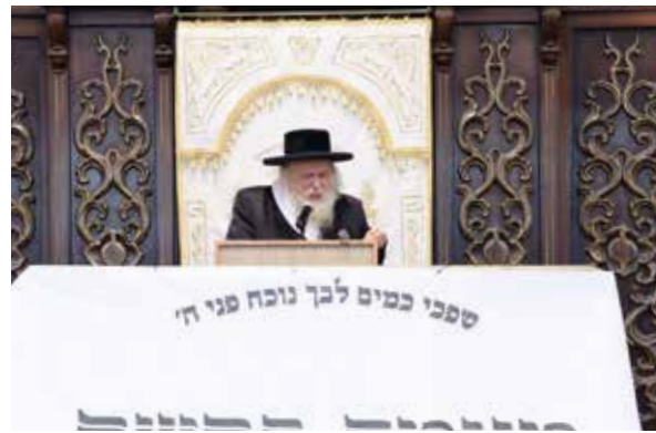
כ"ק האדמו"ר ממבקשי אמונה שליט"א