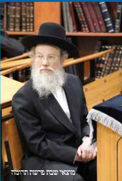
מוצאי שבת פרשת תרומה