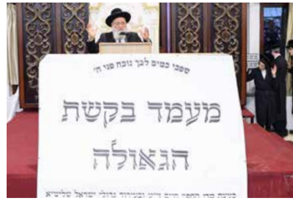
הגאון הגדול רבי ראובן אלבו שליט"א