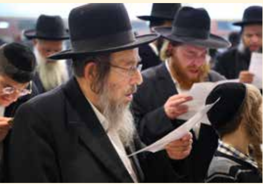
הגאון הצדיק רבי יעקב קופשיץ שליט"א