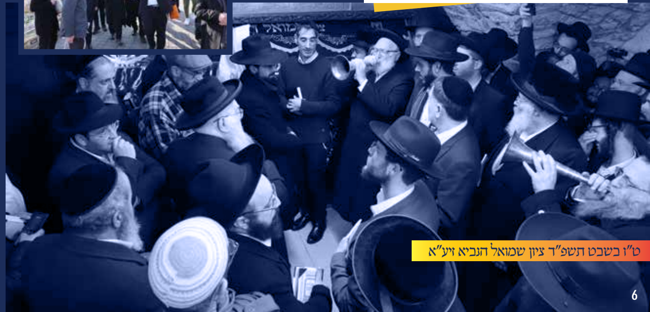
ט"ו בשבט תשפ"ד ציון שמואל הנביא זיע"א