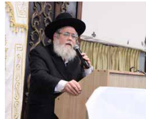
הגאון הגדול רבי ישראל מאיר שושן שליט"א