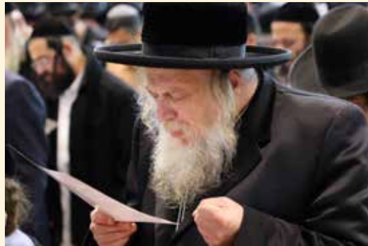
כ"ק הארמו"ר ממבקשי אמונה שליט"א