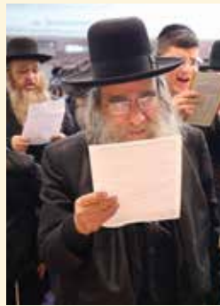
בתמונה הגאון הגדול רבי נתן קופשיץ שליט"א בכניסו.

ביום ה' אדר א' הגיע הרה"ג רבי אליהו סופר שליט"א להגאון הגדול רבי נתן קופשיץ שליט"א מרא דאתרא דבית שמש לבקש ממנו לחתום על הקול קורא לבקשת הגאולה, לאחר שהרב חתם אמר לו ר' נתן נו מתי עושים כינוס גדול בבית שמש, והרב סופר אמר שהוא מקוה שיצא לפועל במוצאי שבת פרשת