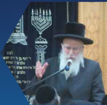
הגאון הגדול רבי שמואל אליעזר שטרן במעמד