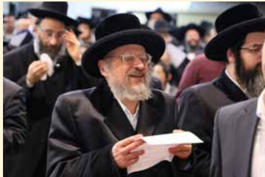
כ"ק הארמו"ר מאנטניא שליט"א