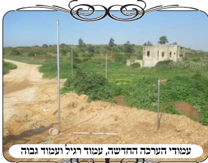
עמודי העירוב החדשה, עמוד רגיל ועמוד גבוה

הערכה החדשה ניתנת לרכישה, ולהקמה עצמית. עלות כל ערכה היא כמה מאות שקלים בלבד, לפי כמויות העמודים הנדרשים [100 שקל לכל עמוד]. וכמובן תלוי איזה גודל שטח רוצים להקיף, ואיזה גובה עמודים רוצים לעשות. וזה תלוי אם מיועד למקום שעוברים בו רכבים, או רק אנשים, או עבור פירצה שלא עוברים בה ורק צריך לעשות צורת הפתח, שאפשר לעשות אותה נמוכה.