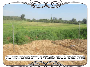
צורת הפתח בשטח מעמודי העירוב בעירוב החדשה

בשורה חדשה לעולם העירובים, עם פיתוח ערכה חדשה להתקנת עירובים זמניים, גם במקומות שאין אפשרות לקשירת החוטים לעמודי חשמל קיימים. בערכה זו ניתן להעמיד לבד עמודים מברזל, בצורה יציבה, וגם ניתנת לפירוק ולהעברה למקום אחר, או להרחבת העירוב במקום הצורך, בלי צורך בכלים מיוחדים.