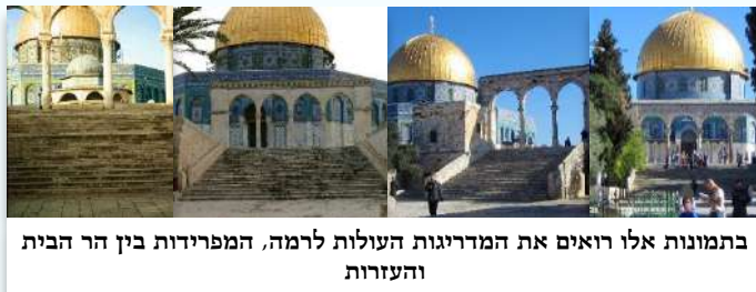
בתמונות אלו רואים את המדרגיגות העולות לרמה, המפרידות בין הר הבית והעזרות