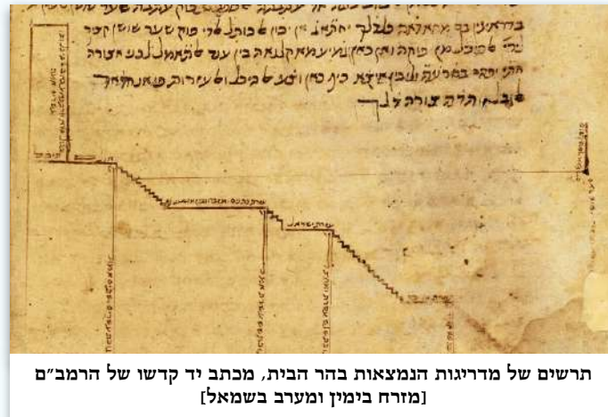
תרשים של מדרגות הנמצאות בהר הבית, מכתב יד קדשו של הרמב"ם (מזרח בימין ומערב בשמאל)

הרמב"ם (הלכות בית הבחירה פ"ו) מסביר את המעלות האלו שהן מקבילות לעליית ההר הטבעי: "המקדש כולו לא היה במישור אלא במעלה ההר - כשאדם נכנס משער מזרחי של הר הבית מהלך עד סוף החיל בשוה, ועולה מן החיל לעזרת הנשים בשתיים עשרה מעלות וכו' נמצא גבה קרקע ההיכל על קרקע שער המזרח של הר הבית שתיים ועשרים אמות." [ראה תמונה]