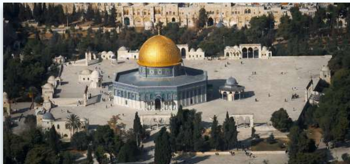
באמצע ההר יש רמה שעליו נבנתה כיפת הסלע. חומות שטח זה מקבילים בעיקר לחומות הר הבית, מלבד החומה המזרחית של רמה זו, שהוא מכויין ממש לרוחות העולם. [מזרח בימין ומערב בשמאל]