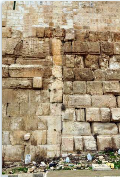
ה'תפר' בקצה הדרומי של החומה המזרחית הבנייה החדשה בשמאל - דרום, והבנייה העתיקה בימין - צפון