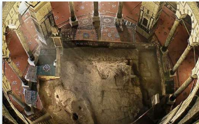
זו היא אבן השתיה שנמצאת בבנין כיפת הסלע. ניכר שזה פסגת סלע ההר.

וכן כתב תלמיד הרמב"ם (בתיאור מסעותיו, נדפס כנספח לספר כפופ"ח ח"א) "על אבן שתיה בנו מלכי ישמעאל בנין מפואר מאד, עשו אותו בית תפלה, ובנו למעלה מן הבניין כפה נאה מאד, והבניין על בית קדשי הקדשים ועל ההיכל".