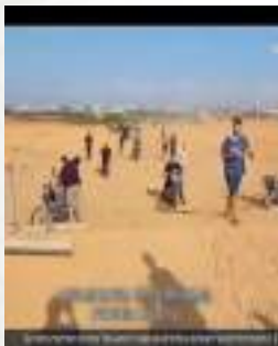
מחבלים ואזרחים נכנסים בהרף עין לישראל כמו בטויל שנה

איך החמאס התיימר להיכנס לישראל עם אופנועים, ולא חשש מחיסול מהאוויר ע"י עשרות מטוסים ומסוקי קרב? איך החמאס ידע שלא הולכים להגיח תוך דקות מטוסי קרב ולחסל טרקטור שפורץ זמן רב את הגדר? איך החמאס ידע שחיל האוויר הנמצא בכוננות כל הזמן, לא ישלח מטוסים ומסוקי קרב במשך כל כך הרבה שעות? איך החמאס התיימר בכלל להיכנס לישראל לאור היום כשהוא מכיר את היכולות של חיל האוויר והשריון הישראלי? איך החמאס ידע שלמרות כל ההתרעות המתגברות מיום ליום - צה"ל לא יעלה כוננות עם טנקים לעמדות קדמיות? איך החמאס "העז" להתקרב לגדר כשהוא יודע שאפילו על נגיעה של ציפור קטנה - מקפיצים כוחות לגדר? איך החמאס ידע שלא יחכו לו מעבר לגבול אלפי חיילים, עשרות טנקים וצלפים - מוכנים לפעולה? איך החמאס ידע שבדיוק באותו יום ינתנו הוראות "שגויות" לפנות חיילים מהצירים שמובילים ליישובים בעוטף? איך החמאס ידע שכל הגדודים של מאות לוחמי צה"ל שעמדו בסמוך לקיבוץ בארי - לא יפעלו כנגדו כששוטח אזרחים? איך החמאס ידע שבדיוק באותו יום גדוד מיוחד ללוחמה בטרור - לא ימצאו את המפתחות של הנשקיה 12 שעות? איך החמאס ידע שבדיוק באותו יום יהיה "תקלה" ברישום - שיעצרו מאות לוחמי-מילואים מלקבל נשק?