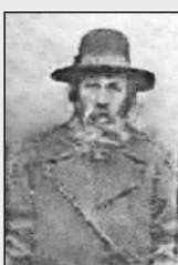
הגרש"י קרליץ זצ"ל