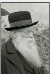
הגר"מ קרליץ זצ"ל