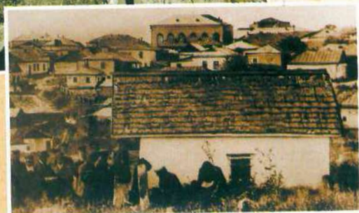
חביבה כת קטנה בארץ ישראל, מסנהדרין גדולה שבחול'ל הקיבוץ בחול'ל ערב ראש השנה תרס"ח, בשנה בה נוסד הקיבוץ בירושלים למעלה. הכותל המערבי באותה תקופה