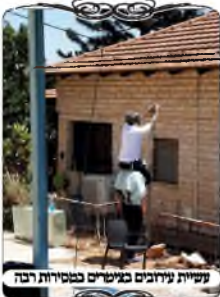
עשית עירובים בנימינים בסמיכות רבה

עשרות עירובים הוקמו בנימינים ע"י המשתתפים בשיעורים במשך ימי בין הזמנים, היו מבין השואלים שהתקשרו למענה הטלפוני לקבל סיוע והדרכה בעשיית עירוב, וצינו שהם עושים עירוב לחצר של