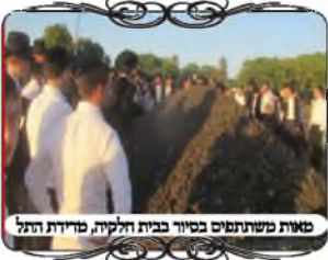
סאות משתתפים בסיור בבית חלקיה, מדינת הנגב

לאחר מכן שולב גם סיור בשדות המושב "בית חלקיה" שאירח אותנו בשמחה רבה. מאות האברכים כתנו רגליהם בעפר, כדי לראות מקרוב מה הדין של כל עמוד או לחי, ומה הבעיה כשיש ערימת עפר גדולה תחת החוט. כמול' הדגים איך מחדדים תל המתלקט, ואיך קושרים בזמנינו את חוטי העירוב לקראת ערב התאספו כולם בחצר בית המדרש, וביחד עשינו אימון מעשי להקים עירוב מאולתר לחצר הסמוכה, עם קשירת חוטים והעמדת לחיים. יחד עם הערכה החדשה