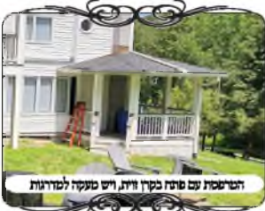
המרבסת עם פתח קרן זווית, ויש מקשה למרבסת

מרבסת עם פתח קטן ומגוון הלכות, ובגדר קרן זווית לאחר שקיבל את פסק הדין ששאל יוכל לטלטל בחצר, הוסיף לשאול האם לפחות במרבסת שבקומת קרקע מותר לטלטל, כיון שהיא סגורה מכל הכיוונים ויש רק פתח אחד ברוחב מטר אחד. והנה למרות שנראה פשוט שמוותר, כי הרי העומד מרובה