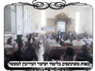
סאות משתתפים בלימוד ושיעור העירובין למעשה

עם תחילת ימי בין הזמנים התקיים יום עיון מיוחד בהלכות עירובין בישוב "בית חלקיה" לכלל הציבור, ללמוד את הלכות עירובין הנוהגים בזמנינו, וכיצד לעשות בפועל עירוב כשר בהתאם למציאות בת ימינו.