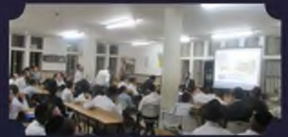
1500 אברכים שלמדו והוכשרו הלכה למעשה ב5 השנים האחרונות