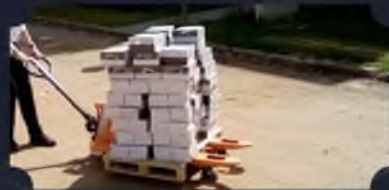
אלפי עלונים יוצאים מידי שבוע להגברת המודעות וחשיבות הנושא