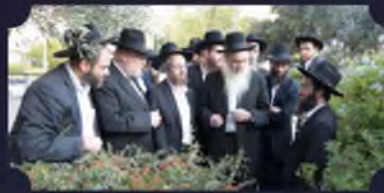
מאות יישובים שנבדקו וקיבלו סיוע והכוונה