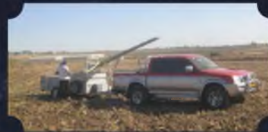
עשרות עירובים שנבנו על ידי מוקד העירוב בשכונות שונות ברחבי הארץ