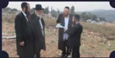
מאות שיחות מידי שבוע למוקד הטלפוני ונענות ע"י מומחי עירוב