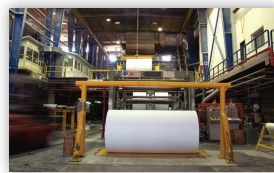
התוצר המוגמר ממנו מיוצר 'נייר ביתי מתכלה'

במפעלי המיחזור הנייר עובר תהליך של גריסה. לאחר מכן הוא מוכנס לבריכת מים עם חומרים כימיים, המוחקים את הכתב, והופכים את הנייר לעיסה ולחומר גלם חדש. ממנו מייצרים 'נייר ביתי מתכלה', דהיינו: נייר טואלט, טישו ומגבות נייר!