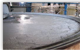
תהליך איבוד הנייר בתוך בריכה והפיכתו לעיסה