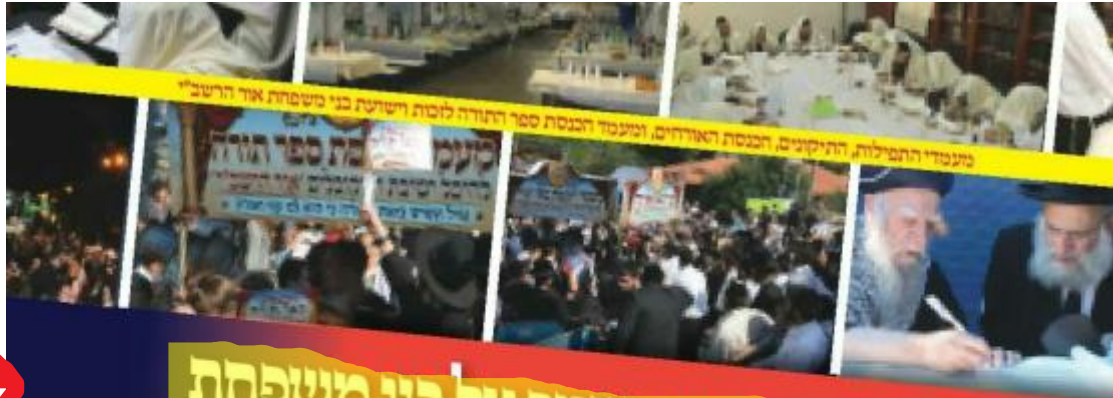
מעמדי התפילות, התיקונים, הכנסת האוהלים, ומעמד הכנסת ספר התורה לזכות רשעת בני משפחת אור הרשב"י