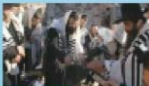
כל יציקה ויציקה של יסודות הבנין נעשית בכונות קודש