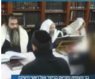
בני משפחת נחמייאס בבית דין ראשי הישיבה

ובלילה האבא הגיע שוב לכל אחד ואחד מהאחים. אך הפעם, במקום עגנת עצבות, הם ראו אותו שמח וצוהל. "באתי להודות לכם" אמר להם.