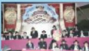
גדולי ישראל משתתפים במעמד הנחת אבן הפינה

חשוב לנו להדגיש, כי כל התורמים שביקשו להשתתף בחודשים מסוימים או בהיכלות שונים, רשמו את שמם ובקשתם באופן מיוחד, כדי שיונצחו לנצח נצחים בבנין קדוש זה, כשכל זכויות הלימוד התפילות המצוות והקדושה העצומה תלווה אותם, את ילדיהם ואת נכדיהם, עד סוף כל הדורות לישועתם ועולם, לזכות רשב"י הקדוש.