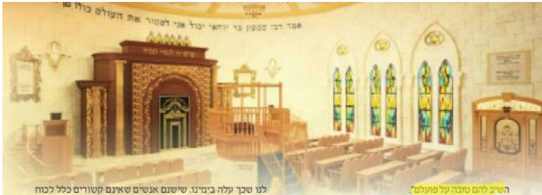
השיבת להם טובה על פועלם.

לנו שכך עלה בימינו, שישנם אנשים שאינם קשורים כלל לכוח הקדושה והם קוראים בקפה למיניהם ומתקשרות ומתקשרים אשר אין דרכם בכוח הקדושה והזהר הקודש. וגדולי המקובלים כבר כתבו בהרחבה כי אין כוחם של ישראל אלא בלימוד התורה הקדושה ובתפילות.