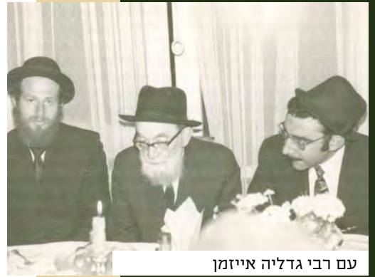
עם רבי גדליה אייזמן