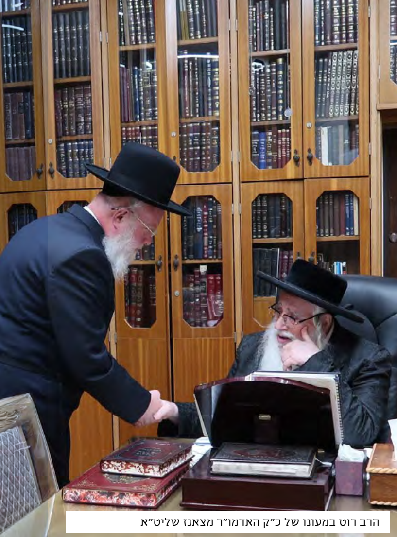
הרב רוט במעונו של כ"ק האדמו"ר מצאנו שליט"א

אחד מהתורה. הוא באר, שלכן כאשר יהושע בן נון כבש את ארץ ישראל הם עסקו בתורה תוך כדי המלחמה כמבואר בחז"ל, כיון שבכל מקום הם למדו את הסוגיה שקשורה לאותו מקום. כך, לפני שבאו לכבוש את יריחו, למדו את המסכת שקשורה ליריחו, ולפני שכבשו את העי למדו את המסכת שכנגד העי. כך בכל מקום ידע יהושע בן נון ברוח קדשו איזה חלק מהתורה מתאים לאותו מקום בשורש הדברים.