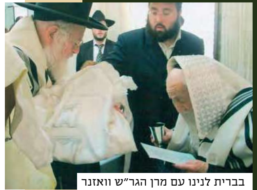
בברית לנינו עם מרן הגר"ש וואזנר

היתה תקופה, שלמדו בישיבת איתרי קבוצה של תלמידים מחו"ל, וארגנו להם