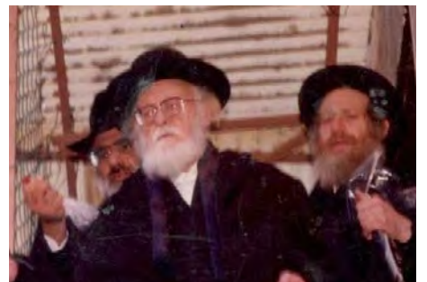
הרב מלווה את מרן הגר"ש אלישיב ביציאה מבית מדרשו

לשלוט בכולם ולהרוס את היידישקייט דרך השליטה שלו בכלכלה, ככה אנחנו צריכים להקים כאן מפעלים, לשלוט בכלכלה, לנווט את מדיניות הבריאות וכך בכל שטחי החיים, וזה מה שיוביל את המדינה מ'מדינת ישראל' ל'מדינת המשיח'. אמנם אבא לא זכה לראות את זה, אבל היום אנחנו מתחילים לראות את זה קורה. לכן השמאל משתולל ברחובות, כי אחרי שבעים שנה שהציבור הדתי התרגל שיש נהג שמחליט לאיזה כיוון נוסעים, ואנחנו יכולים רק לבקש שינמיכו את המוזיקה או שישמיעו לנו מוזיקה חסידית, עכשיו יש בשלטון בפעם הראשונה אנשים שאומרים