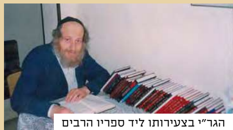
הגר"י בצעירותו ליד ספריו הרבים

פעם ישב הרב על ספסל בתחנה ציבורית ולידו התיישב ערבי זקן. לפתע פנה אליו הערבי וביקש שיסביר לו משנה קשה. הרב שאל אותו לשם מה