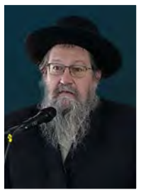
הרב בצלאל גזנז