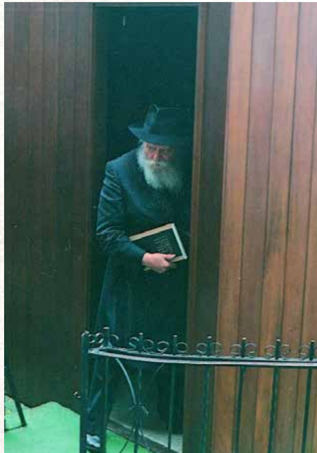
כ"ק אדמו"ר ז"ע, מייסד התקנה, יוצא מסוכתו כשספר רמב"ם בידו

יחד והגענו למסקנה שהכי טוב יהיה לימוד הרמב"ם היומי פרק ליום. "התייעצנו גם עם הרבי שלנו שאמר שזה רעיון מצוי, וכידוע שגדולי החסידות אמרו שלימוד הרמב"ם הוא סגולה ליראת שמים, וידוע שהאר"י ז"ל שיבח מאוד את לימוד הרמב"ם כיוון שהלכותיו מקיפות את כל התורה ואמר שמי שלומד את הרמב"ם לא יגיע לעולם שוב בגלגול. היום, למרבה העניין, מצטרפים ללימוד הזה עוד מבני המשפחה וחברים ומכרים. זה עניין נפלא שמחזק את האחדות הפנימית, מעבר לעוד עניינים רבים ויתרונות שלמדנו במשך הזמן. כל יום אנו מגלים דברים חדשים דרך הרמב"ם".