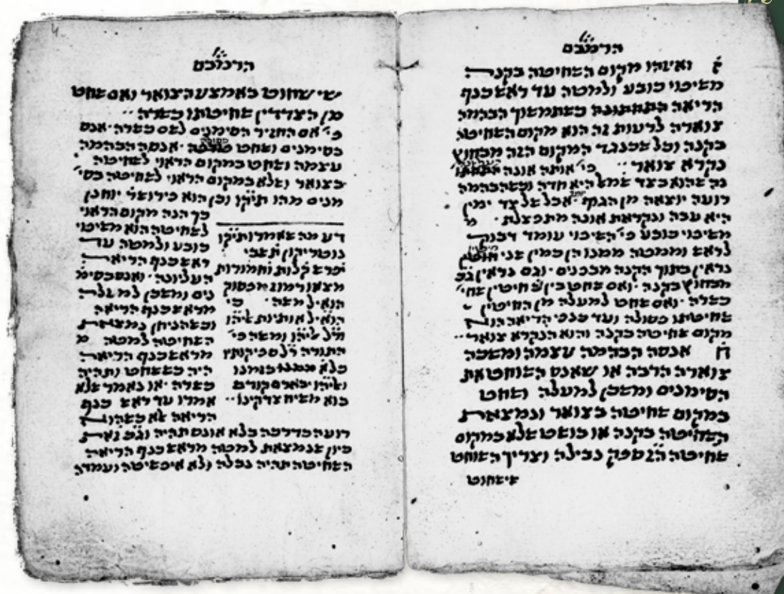
כתב יד תימני של אחת מהתקנות ספר היד החזקה להרמב"ם