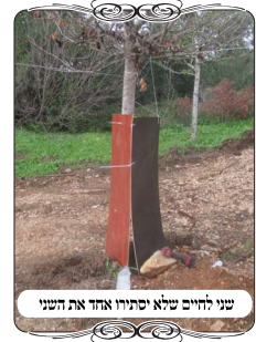
שני לחיים שלא יסתירו אחד את השני

מלבד הצורך בחומרים טובים, צריך גם לדעת הלכות רבות, בפרט כשעושים בצורה לא סטנדרטית, זה דורש הרבה שימת לב יותר מהרגיל. נביא כאן קצת מהדוגמאות שהיו לנו בימים אלו. במתחם המדובר היה צריך לעשות צוה"פ על שטח דשא באורך כמאה ועשרים מטר. במצב כזה אי אפשר לעשות חוט אחד ארוך כל כך, צריך לחלק לשלושה או ארבעה פתחים, כדי שיהיה יציב גם ברוח. איך אפשר להעמיד עמוד יציב באמצע דשא, בלי לקלקל. בס"ד היתה שם נדנדה שבורה שאינה בשימוש, שהמעמידים שלה היו יציבים, קשרנו את החוטים לעמוד שבאחד מפינותיה, כמובן שהחוט יוצא מהצד של העמוד, וחייבים להעמיד לחיים. אבל כשבאנו ללחי העמיד לחיים, שמנו לב שהמסגרת והעמודים של הנדנדה נוטים, ואם נצמיד לחי הוא לא יהיה תחת החוט. חיפשנו מסביב משהו שיעזור לנו להרחיק את הלחי מהעמוד, ומצאנו חתיכת צינור, והכנסנו אותה בין הלחי לעמוד, ועי"ז הלחי היה רחוק כראוי.