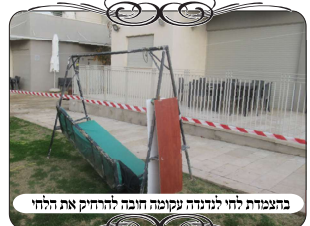
בהצמדת לחי לתנודת עקומת חובה להרחיק את הלחי

יש לציין שצריך להיערך לתיקון עירוב במתחם. לאדם שאינו מנוסה, נראה שזה קל מאוד, קושרים חוטים לעצים ולעמודי חשמל, וקושרים לחיים, ויש עירוב. אבל מי שמנוסה ויודע את ההלכות, יודע שזה לא פשוט כלל. דבר ראשון צריך חומר טוב, אם לא מצטיידים בלחיים וחוטנים טובים, עלולים להיתקע בהשתמשות בדברים שאינם כשרים. אם מביאים קרשים כעין לייסטים, גם אם עבים זה עדיין לא לכתחילה, כיון שעושים צוה"פ ארוכה, הרי החוט יכול להתנדנד מעט יותר מרוחב העמוד, וגם כשמתחם את החוט הרי העמוד נמשך ומתעקם ונכנסים לבעיה של עמוד עקום. כמו כן קשה להעמיד לחי כשהעמוד עקום, כי צריך להרחיק אותו עד שיהיה תחת החוט. יש סבורים שעשיית העירוב פשוטה משום שקושרים חוטים לעמודי חשמל וקושרים לחיים וזהו. אבל הרבה פעמים אין עמודי חשמל ועמודי תאורה בכל סביבות החצר, וצריך למצוא פתרונות טובים, שיהיו גם חזקים, בשביל למתוח את החוט, ולהעמיד לחי שצריך שיהיה חזק כדי להעמיד דלת קלה [כמבואר בשו"ע סי' ס"ב סי"א]. לכן מי שרוצה לעשות עירוב כראוי, חשוב לבוא מצויד בדברים הנכונים, וגם כדאי לראות לפני כן מה התכנית שאפשר לעשות, כדי שהעירוב יהיה טוב.