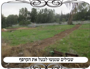
שבילים שנעשו לבטל את הקרפף

במתחם אחר בכפר נופש גדול שנבדק בשבוע האחרון, היה דבר יפה שעשו כדי להכשיר את העירוב. מדובר במתחם גדול מאוד שמוקף בגדר חזקה מסביב, אין בגדר פירצות או מחיצה תלויה, אבל היה ידוע שיש במתחם שלשה שטחים גדולים יותר מבית סאתיים, שיש בהם קוצים וצמחיה גבוהה שמונעת מלהשתמש במקום. במצב כזה דעת הגרי"ש אלישיב זצ"ל שמקומות אלו נחשבים קרפף [כמו דין זרעים או מים שמלאו את החצר בשטח של בית סאתיים, שכתב השו"ע (סי שני"ח ס"ו) שהם אוסרים לטלטל], והם אוסרים את כל המתחם משום שהוא פרוץ למקום האסור, וכך מקפידים בכל העירובים השכונתיים. אמנם בעירובים העירוניים מקילים בזה באופן שיש רק קוצים ולא זרעים שנזרעו בידיים, ולכן הנהלת המתחם לא טיפלה בענין. אבל כיון שהם משכירים הרבה לקבוצות חרדיות, היו כמה פעמים שהשוכרים עשו בלגן, והעמידו בתוך המתחם גדרות וחוטים ולחיים כדי להכשיר את העירוב, עד שהיה שווה להם לטפל בעצמם. בשטח אחד שהיה צמחיה עבותה, הם פינו את רוב הצמחיה לפני שנתיים בתקופת הקיץ הלוהט מחמת חשש לשריפות. בשטח השני הם עשו מסלול לרכיבת סוסים, ויש להם חווה טיפולית, ממילא גם הוא עומד לשימוש, והשימוש הזה נחשב משמש לדירורים, כיון שהוא משמש להנאתם, ולא כמקום מלאכה בלבד [שגם לגבי מקום מלאכה יש חילוקים שאכמ"ל]. נשאר רק השטח השלישי, שהוא בגודל של כמה פעמים בית סאתיים, שבו היו עושים גדרות וצורות הפתח בכמה מקומות.