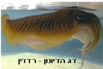
דג הדיונון - רדזין

לאחר הבישול ביורה עם הסממנים נהפך הדם לנוזל צהוב שממנו אפשר לצבוע בו. ואם נחשף במהלך הצביעה לשמש נצבע ממנו תכלת. לאחר זמן מועט שמתחמצן באויר. ואם לא נחשף לשמש נצבע סגול.