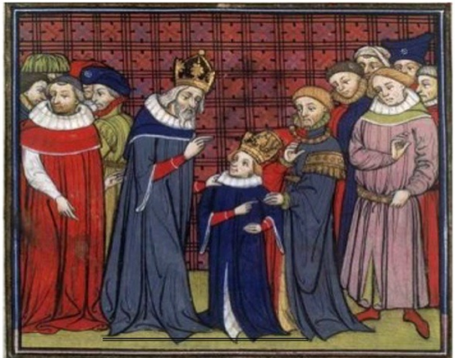
תכלת וארגמן לבושם ציור מפורסם של מלך קרל הגדול עם בנו לואי מלכי צרפת לפני כאלף ומאתים שנה לבושי תכלת