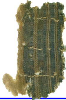
בדים עתיקים מאד שנמצאו בארכיאולגיה ובבדיקות מעבדה נמצא שהם מהחילזון הפרפרא, וכן הצבע הסגול והכחול מאותו החלזון