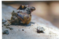
חלזון לאחר פציעתו