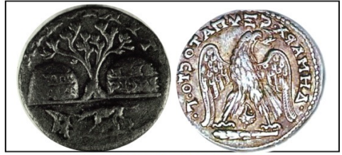
מטבעות עתיקות מצור ועליהן צורת הפרפרא