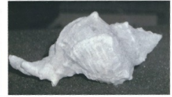
חלזון שניקו את הפסולת מעליו