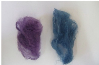
בעיניי ראיתי-אצלי בבית ראה עדות אישית (עמ' 55)