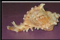
פרפורא ארגמן חד קוצי