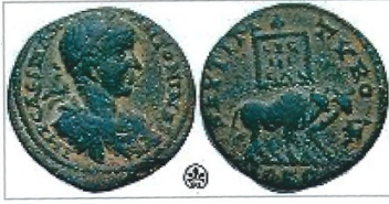
מטבע צורי מתקופת הקיסר אלאגבאלוס. על צידו האחד (בתמונה, צד ימין), מוצג צמד שוורים ומימינו קונכיית ארגמן.