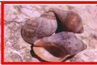
פרפורא אדומת הפה צובע אדום