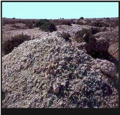
ערימות ענק עתיקות באזור צור של קונכיית של הפרפרא שבורות במקום הצבע