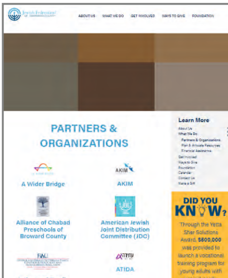
עמותת "עתידה" ברשימת השותפים של הפדרציה הרפורמית של מחוז ברוורד (Broward)

לעומת 3 סמינרים בשנה הקודמת (וולף לויין וליברמן) השנה נכנסו לפרוייקט עוד 4 סמינרים * מספר המשתלבות בביקוש לתכנית גובר והולך * המספרים בהקשר לגיוס 8200 מוסתרים מעיני הציבור