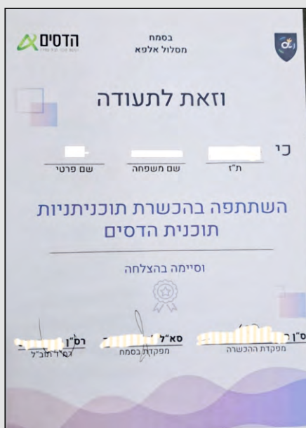
על החתום: רב סרן וסגן אלוף