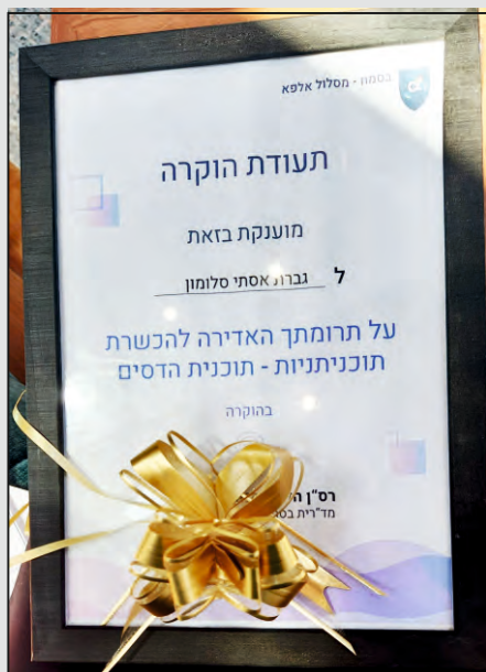
תעודת הוקרה לגייסת מרס"ן צבאי

במסגרת הקמפיין מתוכנן להתקיים ביום ד' טבת "זובינר" (היכרות עם תוכנית הדסים באופן מקוון באמצעות תוכנת הזום), שבמהלכו תציג מנהלת התוכנית א.ס. את פרטי התכנית וכן יינתן זמן לשאלות ותשובות. בפרסום נכתב כי יינתן בו מענה ל"כל מה שרצית לדעת ולא היה לך את מי לשאול. מה זה תוכנית הדסים ולמי היא מיועדת? מה