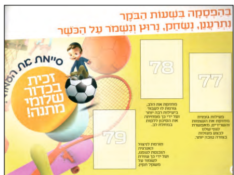
מהבוקר ועד הלילה...

אך עדיין לא סיימנו את כל הדברים המאד חשובים שהילדים יידעו. הנה הדבר החשוב הבא: "בהפסקה בשעות הבוקר, נתרענו, נשחק, נרוץ ושמור על הכושר". קצת לא מובן. האם יש ילדים שאינם רצים ומשחקים בהפסקות (כשהתתי"ם ובתי יעקב פתוחים...)? האם החוברת נועדה לפגועי גוף / מח שאינם יכולים לשחק? איזה צורך יש להסביר לילדים ולשכנע