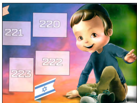
דגל ישראל, איך לא!?