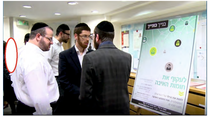
אחד מבוגרי "מכון מנדל" מציג בפני חבריו את הפרויקט שיזם להסרת המחיצות בין חרדים לחילונים

הרפורמה הגדולה של משרד החינוך להקמת ישיבות תיכוניות לציבור החרדי – בוגר המכון.