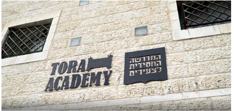
מוסד הכלאיים שהוקם ע"י אחד מבוגרי "מנדל". בעברית: "המדרשה החסידית" - באנגלית: "תורה אקדמי..."

במצב זה, קשה עד בלתי נתפס לעכל את העובדה שדמויות מהציבור החרדי, רבנים, נציגי ציבור, ואישי חינוך שונים, נוטלים חלק ביוזמה זו. ולנוכח כל המידע המבהיל חובה עלינו לפקוח עינים, ולהתנתק מהם ומהמונם לגמרי.