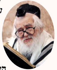
ח"ב מכתב ע"ח)

מרבן בעל ה'אבי עזרי' הגרא"מ שך זצוק"ל, כתב על כך בזו הלשון: "ואני בתומי הולך, וכפי שקיבלנו מרבותינו מדור הקודם, שמאז ומעולם היו חשבונות כאלו להציל הרבה על ידי פשרות בסדרי החינוך שלנו, והתנגדו בכל התוקף לענין כזה, כי חינוך אחר מסכן את הישיבות שמהם תצא תורה". (מכתבים ומאמרים