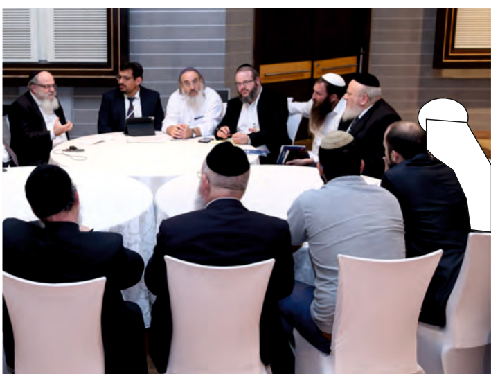
שולחן הדיונים על גורלם של בחורי ישראל בועידה. ערבוביא של חרדים, דתיים וחילונים, גברים ונשים...

שציין, כי תחת "אורט" פועלות 12 מסגרות שעטנו שונות לבחורים חרדיים. כך נוטלים גורמים חיצוניים אלו, המבצעים את שינוי החינוך החרדי וצביון הישיבות בדרכים רבות, את שרביט ההנהגה וההשפעה על הציבור החרדי, במיוחד מכל רחבי הארץ, כשטרם הועידה פורסם על שורת פאנלים שיתקיימו בועידה בנושאי "הכוון ורישום", עם צוות מקצועי המלווה את בני הנוער החרדים הישר אל מוסדות השעטנו רח"ל. נדמה, שאין צורך להרחיב במילים על גודל הסכנה וההרס הרוחני של יוזמה זו, המהווה איום אמיתי על כל החינוך החרדי ועולם הישיבות, וברור שיש לעשות הכל כדי למנוע כל דריסת רגל של גורמים אלו ושל משתפי הפעולה עמהם בתוך הציבור החרדי, במוסדות החינוך ובישיבות הקדושות.