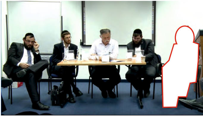
דיון באחד מכינוסי ה'מנדלים'. בתערובת כמובן!

מבפנים. במקביל, באמצעות הקשרים הענפים וההון העצום של "מכון מנדל", הם מקדמים את בוגרי התוכנית, לתפקידים בכירים בשלטון או לתפקידים שיש בהם השפעה על הציבור החרדי במערכות השלטון או בממסד החרדי.