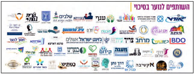
ריכוז של ארגונים ומוסדות שמטרתם לשנות את הציבור החרדי. מתוך מסמכי הוועדה

היוזמה המסוכנת מבוצעת יחד עם ארגון "ענף", שהוקם גם הוא לפני שנתיים, בשותפות של גורמים בכירים בארגוני הסיוע והיעוץ החרדיים הרשמיים, שלמרבה התדהמה נותנים יד למהלך חמור והרה אסון זה. שתי זרועות אלו, ארגון "ענף" ו"נוער בסיכוי", מינו את עצמם למרכזי הטיפול והסיוע לילדים ונערים מתקשים ובחורים נושרים בציבור החרדי, כשבאמצעות כך יש לגורמים החיצוניים גישה ישירה לתוככי מוסדות החינוך