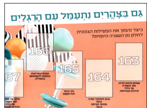
ספורטאות - שגרה יומית