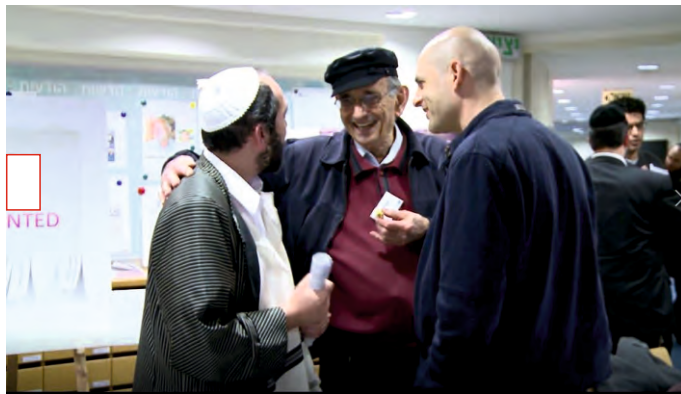
באחד הכינוסים של "מכון מנדל"

לפני עשר שנים (תשע"א) הקים "מכון מנדל" תוכנית מיוחדת לשינוי הציבור החרדי. ייעודה הרשמי של התוכנית הוא; "פיתוח מנהיגות בקהילה החרדית", והשם הנוסף של התוכנית הוא; "תוכנית שלוחי ציבור", והיא מבוצעת בשיתוף פעולה עם "האוניברסיטה העברית". לפי דפוס הפעולה המוכר של הארגון, משמעות הדבר היא, יצירת תמנון רב זרועות בתוככי הציבור החרדי, לשינוי הציבור החרדי מבפנים! הדברים נאמרו במפורש ע"י נשיא "מכון מנדל" בכינוס שהתקיים לפני חמש שנים לרגל הקמת "איגוד בוגרי מכון מנדל", שהסביר את שיטת הפעולה של תוכנית זו, ואמר: "הדרך היא למצוא אנשים מבפנים שישנו