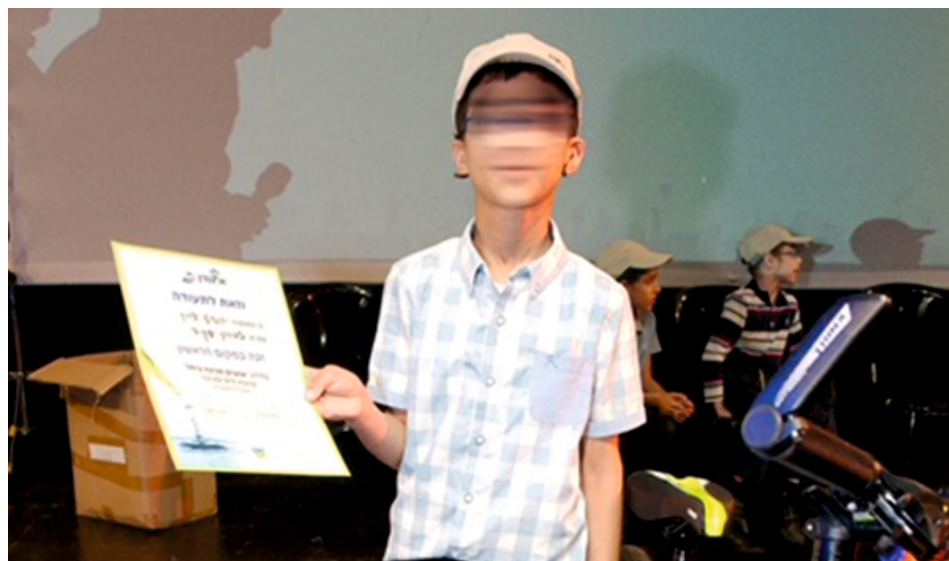
הילד ה"מאושר" שזכה בתעודה עקב בקיאותו בנבכי סוגיית הביוב והמיחזור...

1...ואת הזבל ואת הביוב ואת המיחזור ואת איכות הסביבה... ככל אשר תאווה נפשם של פקידי משרד החינוך