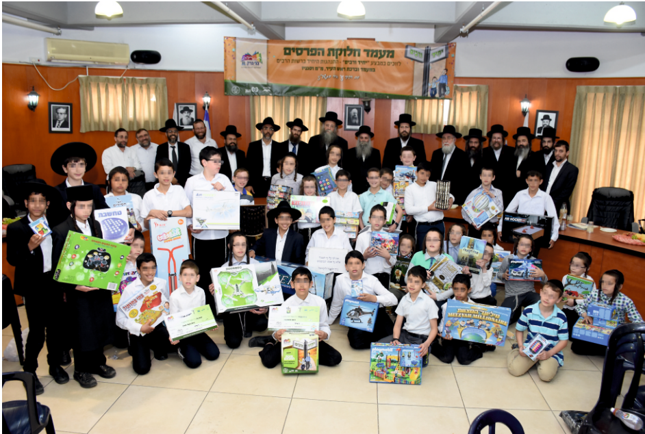
בתמונה: מנהלי תלמודי-תורה ובני ברק ועשרות תלמידים, בטכס שהתקיים באולם הישיבות של מועצת העירייה, לחלוקת הפרסים לתלמידים הזוכים במבצע "יחיד ורבים"

התפעלותם ורצונם להכניס את התכנית לפעילות מעשית במוסדות החינוך בעיר. בטכס חלוקת הפרסים לתלמידים השתתפו ונשאו דברי ברכה, ראש העיר; מ"מ רה"ע; הרב א.ד. סגן רה"ע וראש אגף החינוך, מנהלי אנפים ומחלקות בעירייה, מנהלי תלמודי תורה, הורים וילדים ב-20 ת"ת עם 2650 התלמידים, שזכו לחוייה חינוכית מרתקת. בתום הפרוייקט נערכה ההגרלה הסינית למשתתפי תכנית "יחיד ורבים", שלראשונה נערכה לילדי הת"תים ברמה מקצועית, הושקע און והון למקסם את הגיוון במתנות בפריסה רחבה ומקצועית. בחירת הפרסים נערכה לאחר סקרי שוק ולמידת המוצרים העכשוויים, ובהיבט נוסף, הושם דגש על התאמת הפרסים לתכנית המבצע, כשהמוטיבים רשות היחיד ורשות הרבים מובילים את מדורי המכירה השונים והמגוונים.