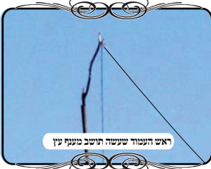
ראש העמוד שעשה חשב מנעף עין

מקרה נוסף שגילה הבודק של מוקד העירוב, במהלך בדיקת אחד הישובים, תושב שעשה לעצמו הרחבה לעירוב של המושב, מפני שהוא לא כלל את לול התרנגולים שלו, ועשה את העירוב בצורה שאינה כשרה. הבודק שהגיע לבדוק את העירוב של המושב, הסתובב יחד עם הרב המקומי וכשהגיעו למקום הזה אמר הרב שהתוספת הזו אינה באחריותו, וכבר העיר פעם אחת לבעה"ב, וראה שלא קיבל את דבריו, ולכן אין לו אחריות על כך. והנה במקרה זה התושב העתיק יפה מעמודי העירוב הקיימים שיש