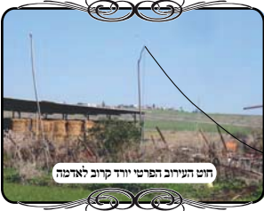
חוט העירוב הפרטי יורד קרוב לאדמה

אבל היתה בו בעיה אחרת, שהחוט הקשור מעל ראש העמוד, היה רפוי ביותר, בצורה חריגה מאוד, עד כדי שהחוט ירד לתוך י' טפחים מהקרע ובצורה כזו הצוה"פ פסולה, מפני שצריך שיהיה בצוה"פ חלל י' טפחים. הדבר הזה מאוד מוזר, משום שמתחת החוט היא דבר קל, וגם אם לא יהיה מתוח לגמרי, מ"מ להשאיר אותו כ"כ רפוי זה פלא. איננו יכולים לדון את הסיבות הגורמות לאותו אדם להזניח כ"כ את העירוב, שהוא סומך עליו למנוע חילול שבת ח"ו.