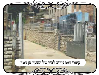
קשר חוט עירוב לציר של השער מן הצד

באחת הישיבות בבני ברק, היתה משפחה שקיבלה את חדר האוכל לשבת בשביל שמחה משפחתית. בני המשפחה היו מהמחמירים שלא לטלטל אפילו בעירוב שכונתי טוב, כמו העירוב שקיים באותה שכונה, ולכן כדי לטלטל את המאכלים מהמטבח לחדר אוכל, הם עשו עירוב למתחם של הישיבה. באחד השערים שעומד פתוח במשך השבת, הם עשו צורת הפתח, וקשרו את החוט לציר שמחזיק את השער. היו אברכים שלמדו מהגליונות לפקוח עין על מלאכת העירובים, ומיד בשבוע שלאחר מכן התקשרו אברכים למוקד העירוב, להודיע על צורת הפתח פסולה שעשו בני אותה משפחה, מתוך הקפדתם על עירוב מהודר.