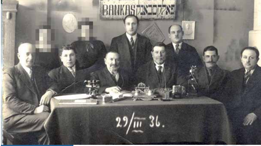
בנקים יהודיים בליטא, 1936.