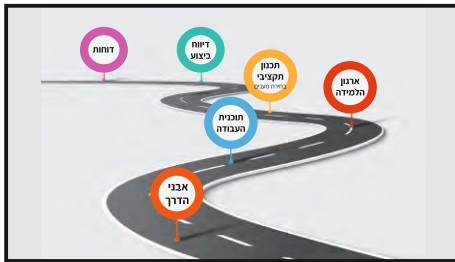
מסלול השתלטות. סדר הפעולות שהסמינרים נדרשים לעבור ברישום לתוכנית