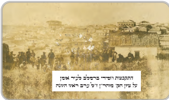
התקבצות וזסידי ברסלב לעיר אומן על ציון הק' מוהר"ן ז"ל ערב ראש השנה