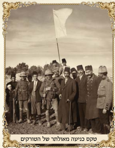
טקס כניעה מאולתר של הטורקים

בגליון הקודם, כתבנו על תולדות צפת משנת תר"א ועד מלחמת העולם הראשונה. כדי להבין מה קרה במלחמת העולם הראשונה (מלחמת 1914-1918), מה קרה עם אומות העולם, ומה עבר על עם ישראל בארץ ובגולה, בצפת ובמקומות נוספים, היה ראוי לכתוב כמה מאמרים על המלחמה, כמה שנים לפנייה וכמה שנים לאחריה. ננסה במאמר זה לתמצת לפחות ב'קצרה'.