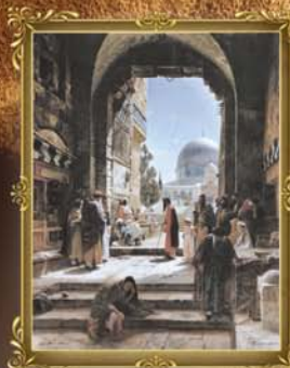
יהודים מתפללים בשער הכותנה, תרמ"ט