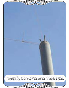
טבעת פתוחה בחוט כדי שיתפס על העמוד

קשור לטבעת. באופן זה החוט ודאי מן הצד, ולכן העמידו לחי לפני העמוד, אלא שהחכמת שלמה הוסיף שצריך להרחיק את הלחי מהעמוד באופן שהוא יגיע מתחת החוט עצמו, ולא מתחת הטבעת. כלומר, לא ניתן להחשיב את הטבעת שהמשך של החוט שהוא המשקוף, והטעם, יש מסבירים בגלל שניכר שהטבעת היא דבר אחר. אבל בדרך כלל שינוי החומר אינו מהווה בעיה להחשב המשך, אלא רק שינוי צורה. ויש מסבירים בגלל שהטבעת שמתרחבת סביב העמוד היא ממשכה בשינוי זווית, ולא בקו ישר, והמשקוף צריך להיות דבר ישר מעמוד לעמוד. לפ"ז יש לדון בענין טבעת שהיא בחוט עצמו, כמו המקרה הנ"ל, האם אפשר שהטבעת תהיה המשך של המשקוף, כי אם אינה המשך, יוצא שהמשקוף שהוא החוט הישר אינו מגיע לראש העמוד והוא פסול. ולהלכה שמענו שיש הוראה בעירובים של הבד"ץ להקפיד גם על טבעת בחוט, שלא