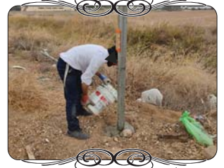
ההקבלנים מעסיקים כמה עובדים יחד, ועושים את המכלול, שזה ניתן לעשות רק בעבודות גדולות והמחיר בהתאם. כמובן שאי אפשר לפעול כך בעבודות עירוב, כי כל מלאכה משמשת לסירוגין ולא ברציפות, אלא מעט מזה מעט מזה, מעט כאן ומעט שם. נדרשים עובדי העירוב להתמקצע בהרה דברים, ושיהיה להם ידע טוב בכל מכלול המלאכות, בנוסף לכל הידע ההלכתי הגדול בהלכות עירובין, ורק אז יכולים להוציא מתחת ידם מלאכה שלימה וטובה.

בהקמת עמוד עירוב יש קושי מיוחד יותר משאר בעלי המלאכה, משום שהוא צורך עבודה במגוון סוגי מלאכות, מכל דבר רק מעט. צריך לעשות חפירה עמוקה כשמונים ס"מ, שדורשת מאמץ לא מועט, ולפעמים גם חציבה עם פטישון או קונגו, כאשר יש בקרקע אבנים. יש מקומות שהעבודה נעשית בידים, וכשיש עבודה גדולה היא נעשית בעזרת טרקטור מיוחד שיש לו את הכלי המתאים לחפירה מעוגלת ועמוקה, והעלות שלו גבוהה שאי אפשר להביא אותו למעט עמודים. לאחר מכן צריך לעשות יציקת בטון, להביא חומר מתאים, לערבב בכלים מתאימים וציוד מתאים. בנוסף צריך לחבר ראש עמוד מקצועי ומהודר, שדורש את מלאכת ההלחמה שהיא מקצוע לעצמו. וכן ניוד של העמודים למקום העבודה שבדרך כלל מפוזר למספר מקומות שונים, שדורש רכב שיכול לשאת את העמודים על הגג. כל מלאכה דורשת את הכלים שלה ואת הידע המקצועי שלה, ובדרך כלל בעלי האומנות אינם עושים את כל אלו יחד, המסגר עובד בהלחמה אך לא ביציקת בטון, והעובד ביציקת בטון אינו עובד בהלחמה עדינה ויפה. אלא