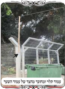
עמוד תלוי ומחובר במוט של עמוד השער

במסגרת העבודות בישוב הנ"ל נתקלנו בצורת הפתח שעשו באחד מהפתחים, ולא השקיעו בה עמודי עירוב תקינים, אלא קשרו שני קרשים לצד של עמודי השער, וקשרו את החוט מעל הקרש. והנה דבר זה אינו כשר כלל, כיון שהקרש אינו כשר לשמש עמוד של צורת הפתח, כי הוא תלוי בגובה למעלה מג' טפחים, וכמ"ש השו"ע (סי' שס"ג ס"י) שגם לחי ועמוד צריכים להתחיל תוך ג' טפחים לקרקע, כמו בכל מחיצה שאם היא תלויה ג' טפחים, שהגדיים יכולים לבקוע תחתיה, פסולה. ואע"פ שהקרש צמוד לעמוד אחר שמתחיל מהקרקע, אינו מועיל, כיון שהחוט לא עובר על העמוד שבקרקע, ועיקר העמוד הוא הי' טפחים הסמוכים לקרקע, ואם החוט אינו מעל חלק זה אינו כשר. ואף למקילים בעמוד נוטה שהחוט על ראשו, אע"פ שראשו נוטה מכנגד הי' התחתונים, זה דוקא בעמוד ישר רק נוטה, כיון שהוא יחידה אחת ישרה, משא"כ כאן שהקרש ניכר שהוא דבר נפרד, וגם אינו ממשיך מעל המוד אלא מהצד של העמוד, א"כ הרי זה צורת הפתח מן הצד, שהיא פסולה. וכך הסכימו רבני זמנינו.