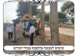
שימוש למעשה בהתקנת עמודי העירוב

בשבוע זה התבצעו עבודות רבות בהקמת עמודי עירוב בעירובים ע"י מוקד העירוב. במהלך העבודות השתתפו גם כמה אברכים ממסגרות השיעורים, שביקשו לבוא לראות בפועל את מלאכת הקודש, ולהתמקצע ולרכוש את ידיעת ההלכה עם הפרקטיקה. בסוף היום הם אמרו שההשתתפות תרמה להם הרבה מאוד לחיות את ההלכות, להרגיש איך מקיימים ומבצעים אותם, וזאת מלבד החלקים המעניינים של העבודות, כיצד חופרים את הבורות לעמודים, כיצד מעמידים את העמוד תוך הבור, מכוונים אותו ומיישרים, מכינים את הבטון, יוצקים לבור, מייצבים את העמוד עד להתייבשות הבטון, ועוד טכניקות מקצועיות שצריך לדעת ולהקפיד שיהיו כראוי בעבודת הקודש.