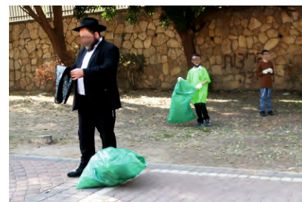
המלמד מחלק שקיות אשפה