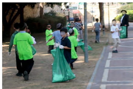
ילדי ת"ת לאוספי זבל!