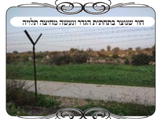
חור שנצרך בתחילת הגדר ונעשה מחיצה תלויה

והנה יש להסתפק בתועלת ובחיסרון שבשינוי הזה מצד כמה דברים הא, האם באמת החורים פוסלים את העירוב של הגדר, ב' האם נכון להחליפם במערכת של צורות הפתח, או להתאמץ לסגור את החורים שבגדר. בענין הראשון האם באמת החורים הם בעיה חמורה שפוסלת את העירוב בדיעבד, התשובה היא שברוב המקומות החור אינו פוסל, מפני שהוא ברוחב שלושים עד שישים ס"מ, וכשהחור נוצר ע"י נפילת חול או שהרשת של הגדר נהרסה, יכול להיות עד מטר וחצי, ובמצבים אלו הרי זו פירצה פחות מ'י אמות [פחות מ 4.5 מטר]. וא"כ כיון שיש בגדר העומדת יותר מהקטע הפרוץ, היא מתרת מדין עומד מרובה על הפרוץ.