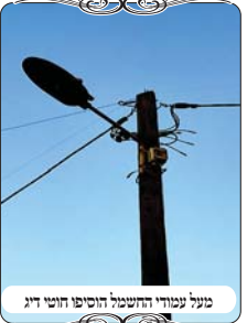
מעל עמודי החשמל חוטי חוטי דיג

במקביל לבדיקת הגדר, בדקנו את צורות הפתח החדשות שנעשו, שכאמור השתמשו בעמודי העץ שמשמשים לחוטי החשמל, אלא שחוטי החשמל הם מן הצד ואינם כשרים לצורת הפתח, לכן הוסיפו עוד חוט של עירוב שעובר מעל ראש העמוד ממש. והנה לתועלת העוסקים במלאכת הקודש, יש לציין שתי חסרונות שמקשים על התיקון של העירוב בעמודים כאלו, וצריך לקחת אותם בחשבון. דבר ראשון עמודים אלו גבוהים יותר משהם מטרים וקשה לתקן את החוט שקשור עליהם, כי המוט הטלסקופי הרגיל שמשמש לקשור את החוט בעמודי עירוב, אינו מגיע לגובה זה. וצריך שיהיה לאחראי ציוד מתאים לתיקון העירוב בעמודים גבוהים במיוחד.