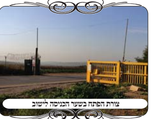
צורת הפתח ביישוב הכניסה לישוב

והנה בתחילת דברינו שאלנו, מה צריך לבדוק בעירוב שכולו גדר, והנה דבר אחד ראינו שלפעמים הגדר אינה שלימה. אבל גם באופן שהגדר שלימה היתה לנו תשובה בבדיקת העירוב הזה, עד כדי שהופתענו לראות. לישוב היו שלשה פתחים. אחד מהם שימש לכניסה רגילה, ובו היה שער שסגור במשך כל השבת [וגם עשו מעליו צורת הפתח, אך היא היתה גרועה מאוד עם עמודים