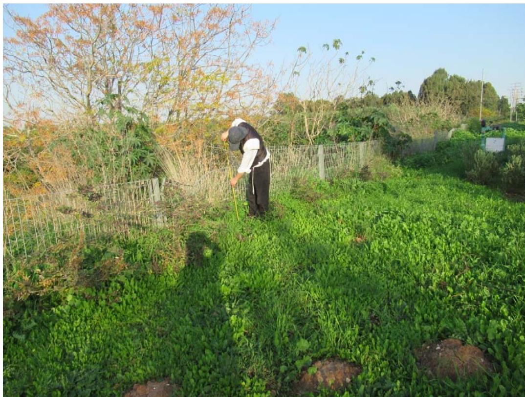
5. בעיר אחרת, איך מחשבים את גובה י' טפחים, מהאדמה או מראשי הצמחים, והאם זה תלוי בכמות הצמחים ובחוזק שלהם. יש בזה כמה שיטות.