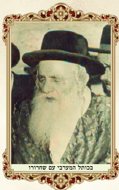
בכותל המערבי עם שחרורו

[*] מתוך אגרת לכ"ק אחיו ה'זכר חיים' זצ"ל