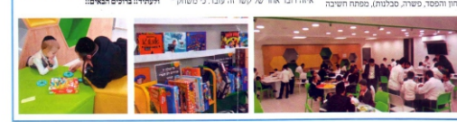
ילדי ביתר עלית והמרכז הקהילתי של ביתר עלית יחדיו יזמו את הפעילות "זמן חורף" - פתחה את שנתה במוצאי שבת פרשת לך - לך, חתוך סטרה לאפשר לכל אב שרצה להשקיע בקשר עם בןו, לפתוח את השבוע בעת משחק חוויה מחברת ומעצימה, תוך פיתוח מיומנויות חשיבה ואתגר.

המרכז הקהילתי של ביתר עלית והמרכז הקהילתי של ביתר עלית יחדיו יזמו את הפעילות "זמן חורף" - פתחה את שנתה במוצאי שבת פרשת לך - לך, חתוך סטרה לאפשר לכל אב שרצה להשקיע בקשר עם בןו, לפתוח את השבוע בעת משחק חוויה מחברת ומעצימה, תוך פיתוח מיומנויות חשיבה ואתגר.