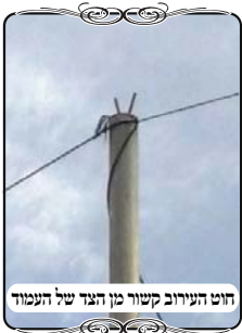
חוט העירוב קשור מן הצד של העמוד

הם עברו יחד על כל ההיקף של הישוב, למעלה ממאה צורות פתח, הבודק נעץ את עיניו כל הדרך בראשי העמודים, יחד עם שימת לב גם לשאר ההלכות הנוגעות לכשרות העירוב. עד שבאחד מהפינות בין החומות, שוב הוא עצר והתבונן וגילה שהחוט קשור מן הצד של העמוד ממש. האחראי התבונן ועזר לו להבין את הסיבה לכך, מפני שהחוט הראשון נקרע, והקושר תלה את החוט החדש על החוט שבצד השני של העמוד, כיון שהיה לו קשה לטפס לקשור בראש העמוד. אילו הוא היה יודע את מה שהאחראי יודע עכשיו, שהחוט חייב להיות מעל העמוד ולא מן הצד, מסתבר שהחוט הזה היה קשור כמו שצריך.