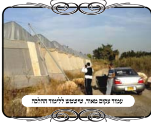
עמוד עקום מאוד, שימש ללימוד חלילה

בדרך כלל אנשים מחכים לסיפורים על דברים בולטים, כמו עמוד עקום בצורה זוויתית, או חוט שיורד עד הקרקע. גם זה היה בישוב הנוכח, עצרנו ליד אחד העמודים, הצלם שהצטרף לסויר הוציא את המצלמה ועמד לצלם, הוא חשש שהאחראי יכנס ללחץ ולבושה, אבל אדרכה האחראי [י"אמר לשבח] עודד ואמר לו תצלם, יהיו עוד שילמדו מכאן וידעו איך לעשות עירוב כשר, יהיה עוד תמונה למצגת, זו מצוה וזכות. ואין שום בעיה.