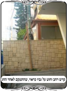
קרש רחב וחוט על גביו כראוי, שהתקנה לאחרי החי

חצר נוספת שביקשה עזרה בעשיית עירוב, חצר שיש לה קירות גבוהים משלש צדדים, וצד החזית פתוח כולו. הגדר שלפני הבנין נמוכה מאוד. במקרה כזה הפתרון הטוב הוא, לעשות צורת הפתח ארוכה, לכל רוחב צד החזית, מקור לקיר. אמנם צריך להקפיד שהיא לא תעבור על מחיצה, ובמקרים כאלו מצוי