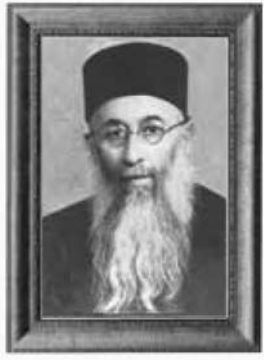
הגה"ק רבי יעקב עדס זיע"א