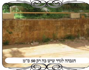
הגבהה לגדר שיש בה רק 80 ס"מ

בדרך אגב יש לציין עוד עצה לפתרונות פרקטיים, במסגרת הסיוע למבקשים לעשות מחיצות, ויוצאים לחפש חפצים לבנות אילתורים לגדרות, ואין כעת קרשים ברחובות, מפני שאין שיפוצים ביתיים. ניתן להשתמש בקרשי הסוכה, שהדפנות ישמשו למחיצות, אלא שאם מעמידים אותם צריך הרבה קרשים ודפנות, לכן ניתן להשכיב אותם, אלא שאם משכיבים את הדופן, וגובה המחיצה היא רוחב הקרש, הרי הוא רק 80 ס"מ בדרך כלל, ואין בו שיעור מחיצה לשיעור חזו"א, כפי שהתקבל להחמיר. והפתרון הוא באחד משני האופנים, א' להגביה את הקרש בעזרת בלוקים וכדומה,