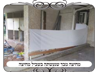
מחיצה מבד שנושטתה בשביל מחיצה

באחת מהחצרות רצו לעשות מחיצה תחת הבנין, וחיפשו פתרון זול וקל, מדברים שכבר נמצאים בבית, ולא צריך להשקיע בהם, [בתקוה שבשבוע הבא כבר נזכה להיכנס להתפלל וללמוד בתוך בית המדרש]. הפתרון שעשו היה באמצעות סדין בד, שקשרו בין עמודי הבנין. אלא שמכיון שמחיצה כזו תתנדנד ברוח, ומחיצה שאינה עומדת ברוח אינה כשרה למחיצה, כמ"ש בשו"ע (סי' שס"ב ס"א) לגבי ענפי האילן. כן הם השכיבו קרש למטה וקשרו את הבד לקרש, ועי"ז הרוח לא תנופף ותרים את הבד.