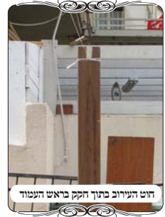
חוט העירוב בתוך חקק בראש העמוד

כמו כן ניתן להיעזר בלייסטים של הסוכה שימשו לעמודים של העירוב. אך גם בזה יש לשים לב לשני דינים. באחת מהצורות עשו עירוב למנין המתקיים בחצר, והשתמשו בלייסט של סוכה שיש בראשו חקק כדי להכניס את הקרת השוכב עליו, כעין פרגולה