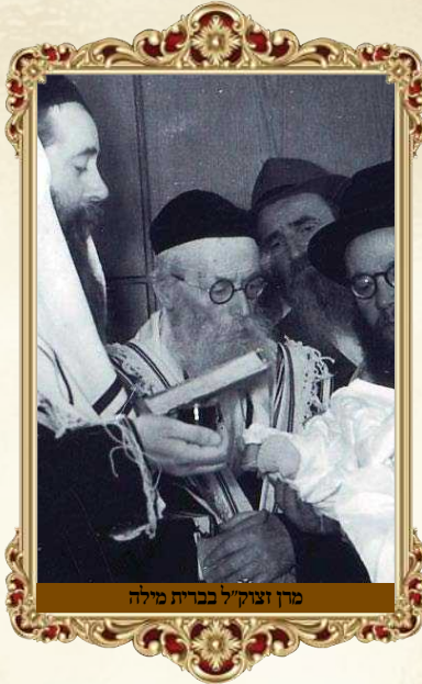
מרן זצוק"ל בכרית מילה

אך באמת כבר השיב מרן החזון"א בעצמו על שאלה זו כדרכו בהגדרה בהירה ומאירת עינים