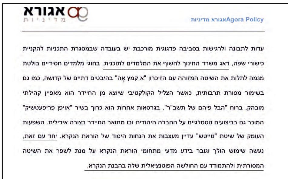
"משרד החינוך דאג לחשוף את המלמדים לתוכנית"

די לנו לראות במסמך רשמי של משרד החינוך (ראה למטה) דיווח על פעילות של משרד החינוך עם מלמדים בתתי"ם בהקשר זה של נושא ה'המחשות', כדי שיהיה מותר לנו לחשוף שהזוועה והתועבה הזו של המחששות על פסוקים בתורה ועל הקב"ה - בהקשרים גשמיים ר"ל, היא פרי המוח הכפרי של אנשי משרד החינוך.