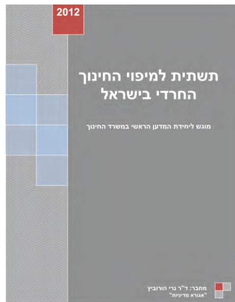
שימו לב: זה אותו ד"ר נרי הורוביץ שכתב את הדו"ח ליבנק ישראל - אותו חוקר ואתם מסקנות!...