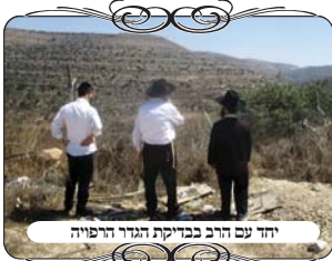
יחד עם הרב בבדיקת הגדר הרפויה

הרב של הישוב שראה את הבעיה והבין את חומרת הענין, שאל את מוקד העירוב כיצד ניתן לתקן את הדבר במהירות [וכמובן המצב שאין לו תקציב מהמושב, אלא דואג לכך