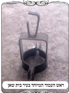
ראש העמוד המיוחד בעיר בית שאן

בשבוע זה יצא מוקד העירוב לבדיקת העירוב בעיר בית שאן, העיר שמוזכרת בנביאים ובדברי חז"ל. בחודש האחרון נתבקשנו מבנו של רב העיר הגאון רבי יוסף יצחק לסרי שליט"א, לבוא לראות את העירוב, אם יש דבר שכדאי או שצריך לתקן, ובמקביל לכך הזדמן שגם הבדוק של העירוב פגש בפעילות של מוקד העירוב וביקש מעצמו שנבוא אליו, כי הוא יודע שיש דברים לתקן, ורוצה המלצה כיצד ואיך.