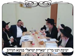
ישיבת רבני בד"ץ "שארית ישראל" בנושא העירוב

בגליון הקודם הבאנו את פתיחת מחלקת עירובין של ועד הכשרות המהודרת "שארית ישראל", שבעז"ה תביא מידע כשרותי מוסמך ועדכני על העירובים השכונתיים ברחבי הארץ. וזאת בנפרד מפעילות מוקד העירוב, אשר פועל גם בתחומים אחרים, ביעוץ ובדיקה לעירובים עירוניים, בנייה והתקנה ועוד.