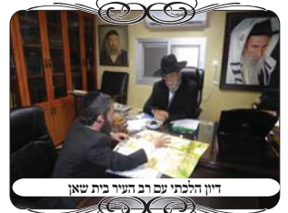
דיון הלכתי עם רב העיר בית שאן

לפ"ז יש לדון במקרה הנ"ל, האם הנחל דומה לדין אמת המים דבר ראשון השאלה האם המים מגיעים לגובה יי טפחים, כי בימות הקיץ המים רדודים מאוד, וגם בימות הגשמים יש רק מעט ימים שיש זרימת מים בעומק יי טפחים. וא"כ יש לדון האם זה פוסל את העירוב בקטע של הנחל, באותם ימים וא"כ גם העיר תיאסר, מפני שבהמשך יש מקומות ששפת הנחל אינה בשיפוע תל המתלקט, והעיר פרוצה אל הנחל.