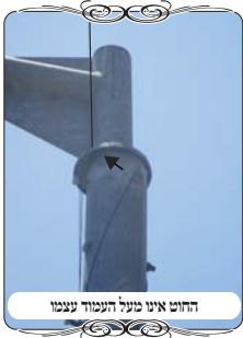
החוט אינו מעל העמוד עצמו

לגודל ההבדל בצורת הקשירה, ויתכן שלאחר זמן שוב יימצא שהעירוב היה פסול. על כן חובה להחליף את ראש העמוד במקרה כזה]. מקרה נוסף שנתקלו השבוע בבדיקת אחת מערי המרכז, וקשרו את חוט העירוב לעמוד רמזור, באופן שיהיה מעל החלק הרחב של העמוד, וייחשב מעל גביו. אבל בגלל שינוי מסוים בעמוד, יצא שהחוט עובר על בליטה בעמוד, אבל אינו מכווון מעל העמוד עצמו, ואינו נחשב מעל גביו. [במקרה זה היה לחי לפני העמוד כדי להתירו].