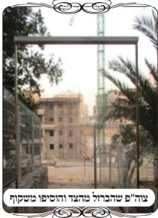
צו"פ שהברזל מוגדר והוסיפו משקוף

כמו כן עסקנו בדיני צורת הפתח מברזל (פרופיל), הנעשית במקומות קטנים כגון בשבילים וסימטאות שנכנסים בהם לעירוב, וכיון שאינם רחבים