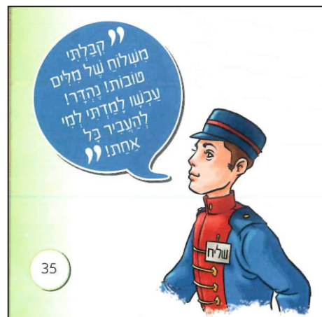
ה'שלח' נעדר כל צורה יהודית, מעביר 'מילים' ומלמד בכך את הליכות התורה

ראש חרדי, וכו'), מה שאמור להיות טבעי ומובן מאליו בכל ספר חרדי.